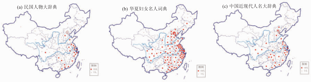
图 1 中国近现代女性人才的地理分布