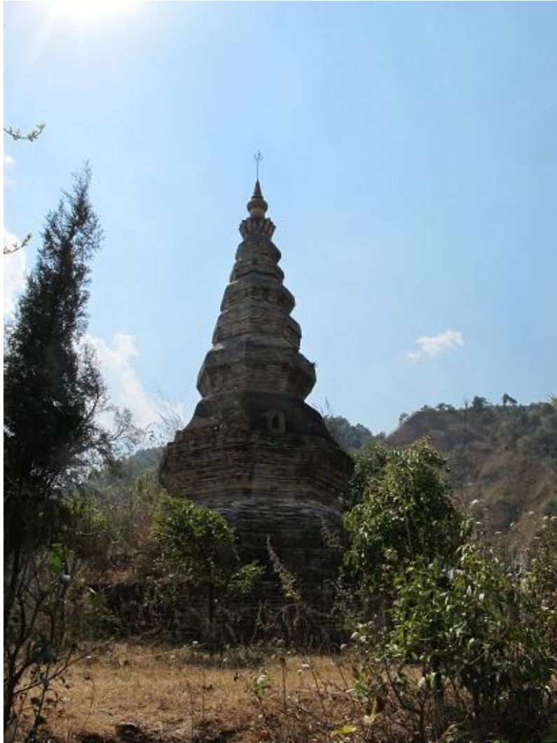
过度开垦导致西北塔面临威胁