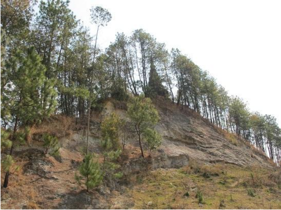
山体塌陷威胁勐旺塔