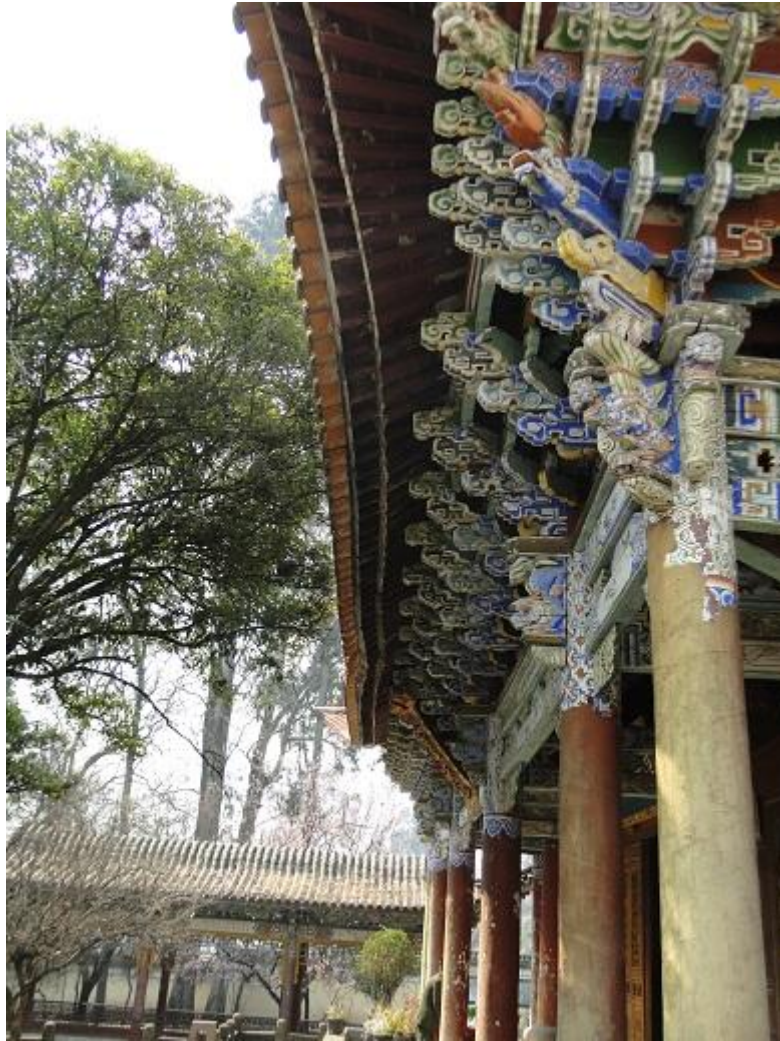
大成殿廊间斗拱彩画