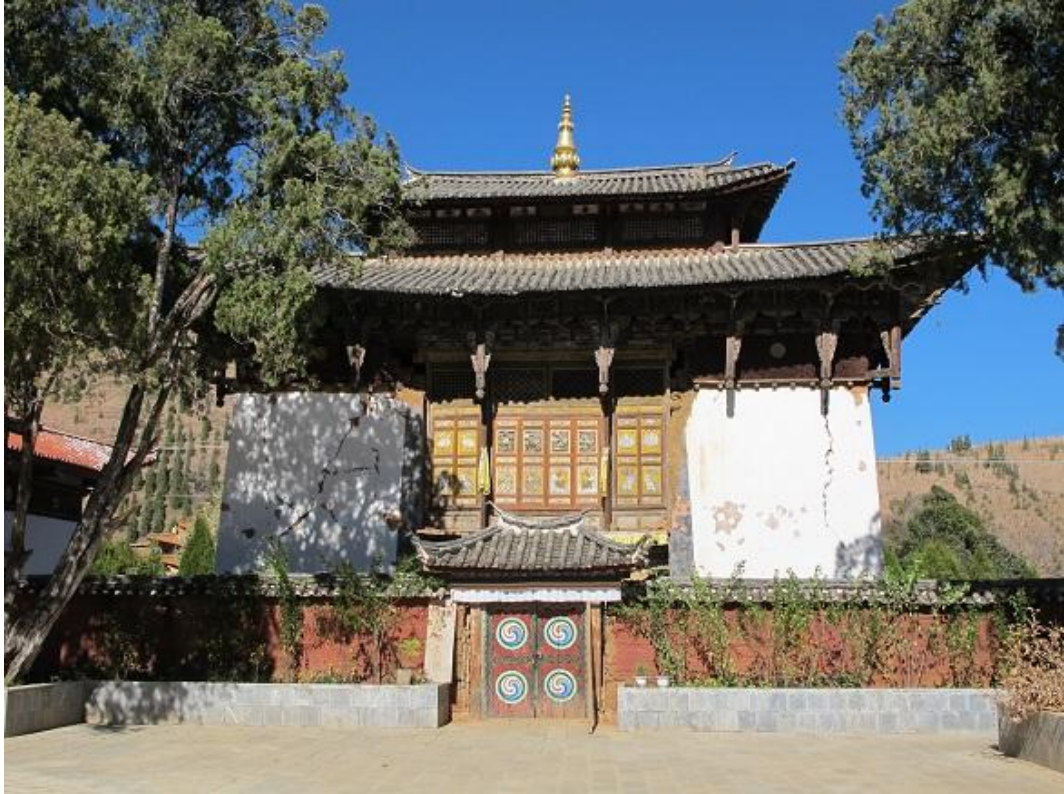
扎美戈喇嘛寺正立面