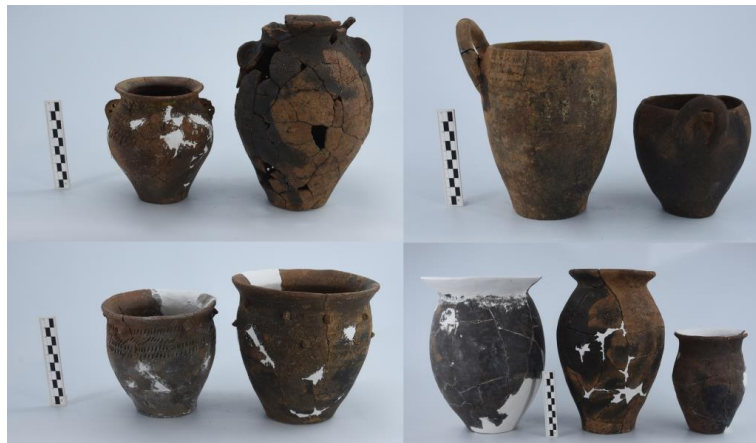
徐家老堡遗址出土陶器