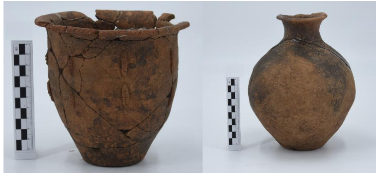
三棵树墓地出土陶器