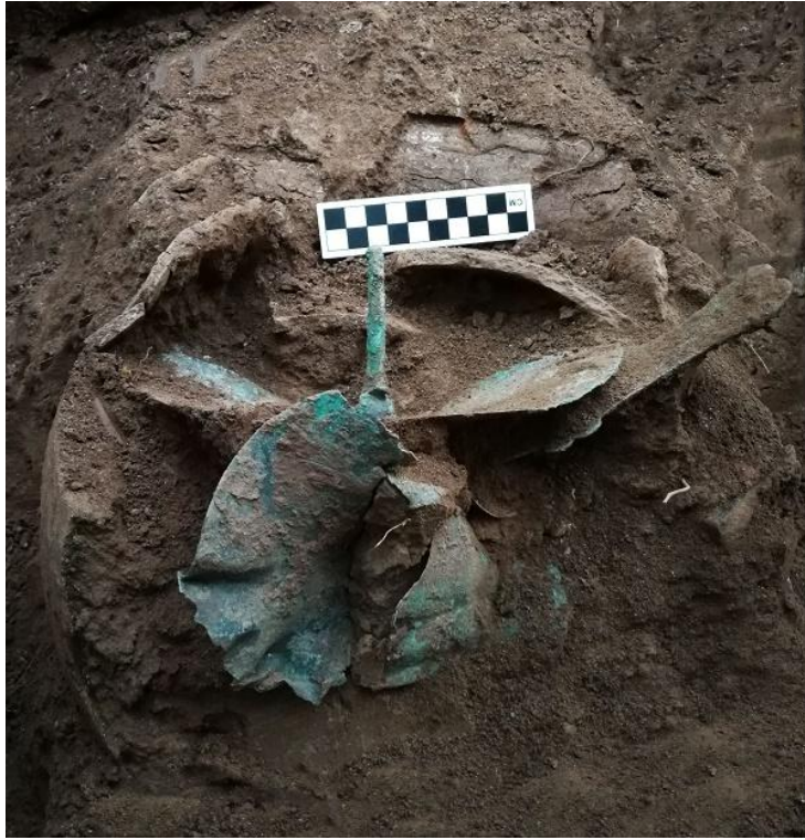
丙弄丙洪遗址铜器窖藏