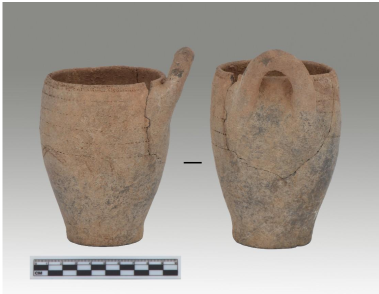
段家坪子墓地出土陶器