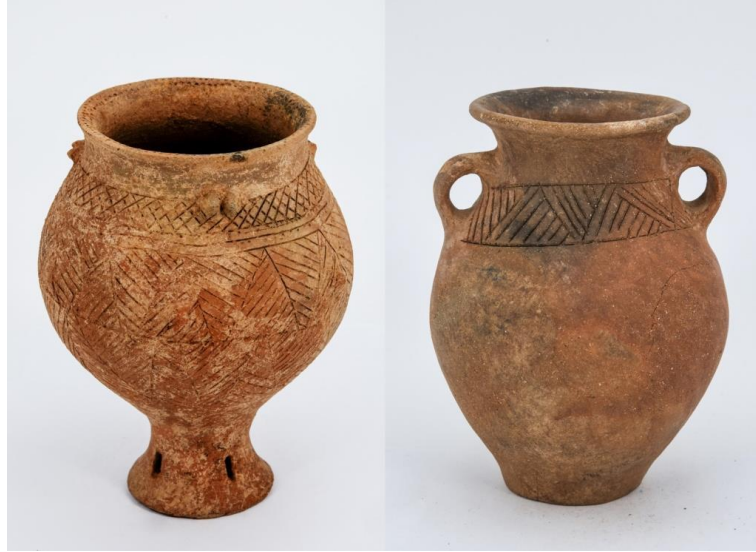
江边遗址出土陶器