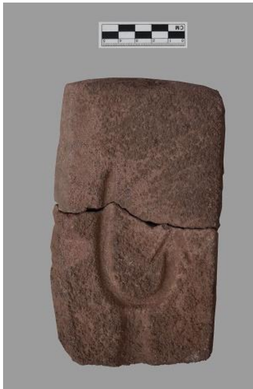
白马口遗址出土石范