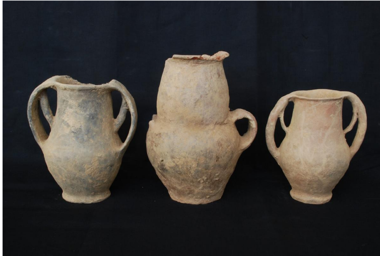
堆子遗址出土双耳陶罐