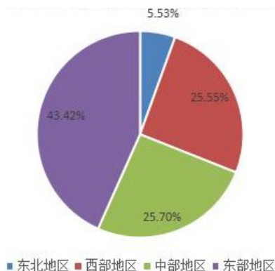
图1 2018年全国林业总产值区域比重

方面推出诸多的改革举措，特别是在开辟森林生态旅游方面取得明显效果，推动了林业总产值的快速增长，森林生态旅游产业已经成为林业企业新的效益增长点。然而，从全国情况来看，西南地区虽然在森林资源储备方面占有很大优势，但其林业产值方面并没有得到显现，东部地区的林业总产值占比达到43.42%，而西部地区的林业总产值占比仅为25.55%，与全国其它地区相比，其林业总产值所占比例不大，并没有充分发挥出其森林资源优势，见图1 [15] 。