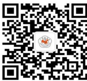
欢迎关注广西医学会微信公众号