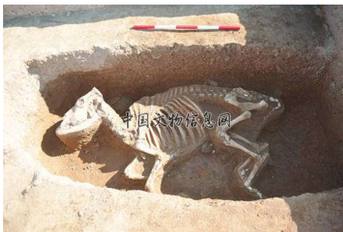
朱仓M722 陵园遗址祭祀坑牛骨