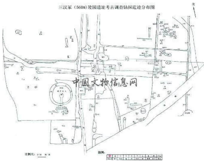
三汉家陵园遗址勘探平面图

东汉王朝共有12座帝陵,除献帝禅陵位于河南焦作修武县境内,其余11座帝陵均位于河南洛阳境内。东汉陵区分为邙山和洛南两个陵区。北陵区位于今洛阳市孟津县境内,南陵区位于今洛阳市伊滨区、偃师市境内。洛阳市文物考古研究院结合“邙山陵墓群考古调查与勘测”项目,