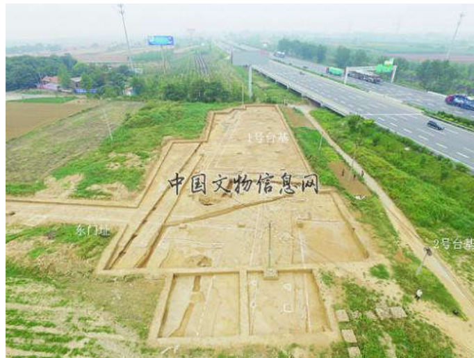
朱仓M722 陵园遗址1 号台基东部及内陵园东门址 朱仓M722 陵园遗址1 号台基东部及内陵园东门址

发布时间: 2018-03-12 文章出处: 中国文物信息网 作者: 张鸿亮 王咸秋 点击率: 668