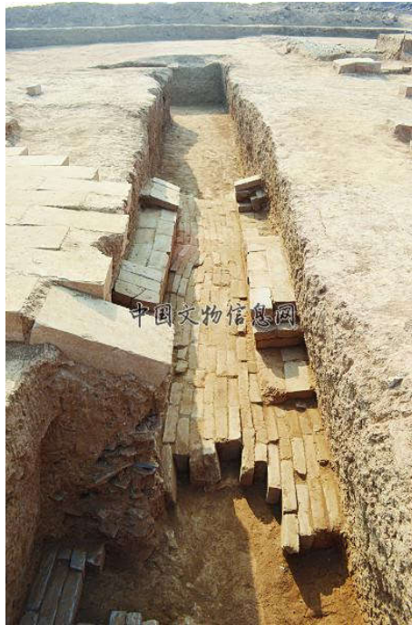
三汉冢陵园遗址勘探平面图

遗址位于洛阳市孟津县朱仓村西部，地处邙山陵区内。陵园平面略呈方形，边长420米，四周有夯土基槽环绕。陵冢位于陵园的中西部，原始封土呈圆形，直径约136米。墓葬平面呈“甲”字形，墓道长50米、宽8.8~10.4米，墓室东西长28.8米、南北宽25米。陵园建筑主要分布于封土东、南部。结合勘探与发掘情况，基本可以确认存在内、外两重陵园。内陵园包括帝陵封土、封土东侧的1号台基建筑单元与封土南侧的建筑单元。外陵园位于内陵园东侧偏北，主要包括2号、3号台基，1号、2号院落建筑单元。针对内、外陵园“垣墙”关键部位进行发掘、解剖，均仅发现夯土基槽而未见墙体。在内陵园东侧发现一处门址，门宽约24.2米，折合汉尺约100尺。