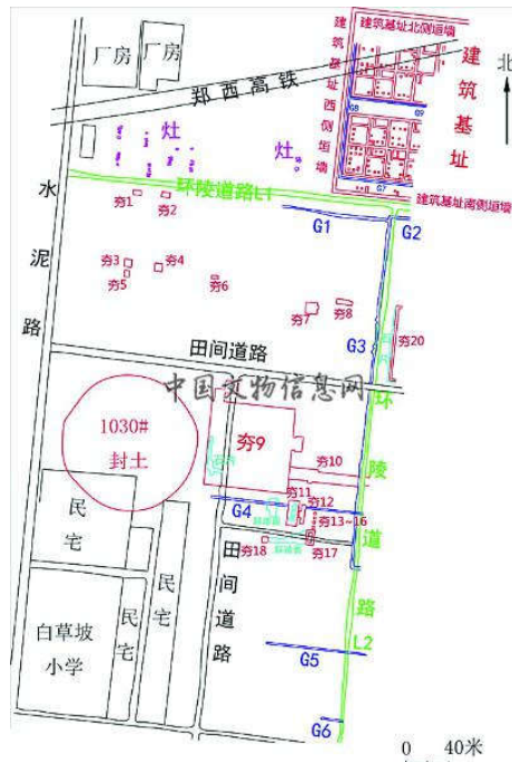
白草坡村东汉陵园遗址勘探平面图

截至目前，白草坡村东汉陵园勘探总面积19万平方米，发掘面积1200平方米。陵园由内外陵园组成，在封土东侧和北侧发现有环绕内陵园的道路。在封土东侧发现一处大型夯土台基，平面近方形，边长约80米。在封土东北侧，发现两组建筑基址群，周围有夯土垣墙环绕，垣墙内发现有排水渠。另外，在封土北侧，发现排列规律的灶共计50余个，初步推测与建造陵园有关。