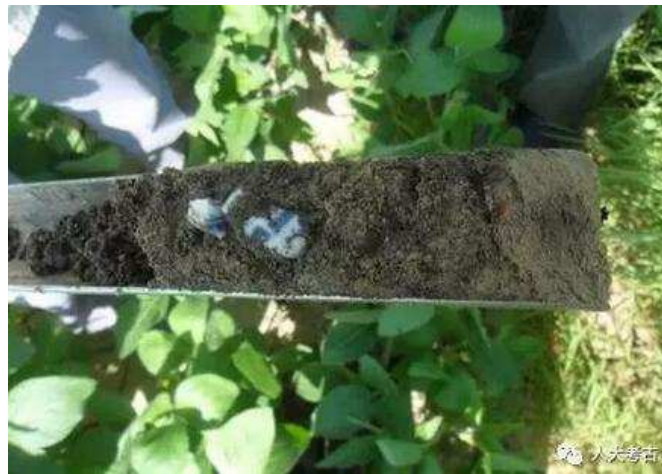
老城北门勘探发现的瓷片