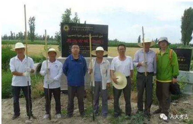
考古勘探人员合影