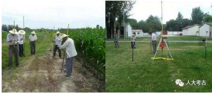
勘探队员在进行勘探与测绘

外侧、老城将军衙署范围、老城北门及瓮城、老城将军衙署主体建筑、老城初建东墙及魁星阁，新城西门、新城南门和新城将军府大堂基址进行了勘探，并利用无人机对可以工作的区域进行航拍，结合三维建模软件对惠远老城和其中重点的遗迹单位进行三维建模和复原。