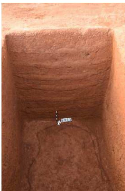
图六 M363填土平面及剖面夯层

墓葬随葬品有陶罐、陶釜、釉陶罐、青瓷盘口壶、青瓷碗、青瓷钵、铜镜（图七）、铜钱、铁刀等，另见漆器痕迹。其中M361出土“米”字纹陶罐，年代应属于西汉早中期；M362出土有“五官大夫造”铭文砖（图八）。除M361、M355外，其余已清理完的墓葬年代基本为东汉时期。