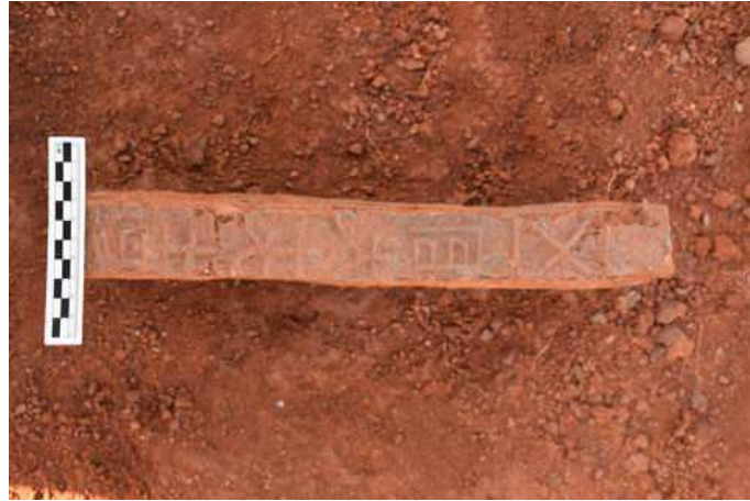
图八 M362五官大夫铭文砖