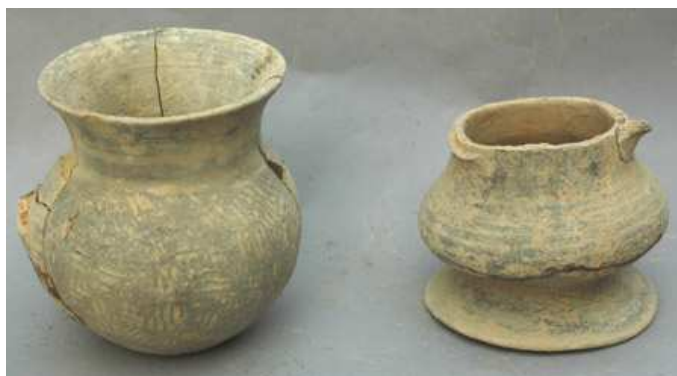
图6 德清小紫山马桥文化时期墓葬出土器物

因此综合近年来遗址、城址、土墩墓等的考古新进展，这一地区的考古面貌已较为清晰，结合环太湖地区的考古基本情况，可以初步确定这一带是良渚文化之后，越国形成之前，包括钱山漾文化时期、马桥文化（或高祭台文化）时期、西周时期诸文化的中心分布区，其政治中心很可能在下菰城一带，其邻近及东部的河网平原是生活与生产区域，西南青山一带的低山缓坡上是最