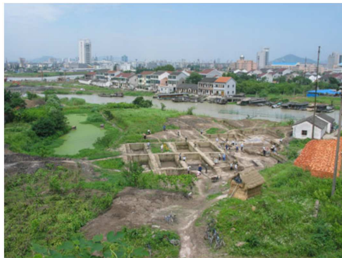
图1 大型遗址: 昆山遗址发掘现场

从目前调查的材料来看,浙江北部的苕溪中下游,尤其是东苕溪中下游包括湖州市区、余杭西部南、德清、长兴东南部等在内的地区,是马桥文化时期至西周春秋时期遗址的最密集分布区之一,目前能确认的遗址当在三十处以上。2010年 - 2011年配合“瓷之源”课题进行的东苕溪两岸狭窄范围内考古调查过程中,新发现这一时期遗址多处,并且在这一带的山坡几乎均可采集到零星的印纹陶与原始瓷片,说明这一时期该地区的人类活动相当频繁。从整个太湖地区来看,这一带不仅遗址数量多、分布密集,而且等级高,因此苕溪中下溪地区是马桥文化时期至西周时期遗址的中心分布区(图1)。