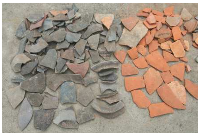
图4 下菰城内城东城墙出土部分陶片

2010年，浙江省文物考古研究所“瓷之源”课题组在邻近的南山窑址发掘之际，对下菰城进行调查，确认内城内有丰富的堆积与遗迹存在。在西南部剖面上可以看到大面积的堆积层，中南部低洼地通过钻探也可以确定地层的存在，中北部采集到同一时期的标本，东南部近城墙断面处小试掘沟内地层不厚，约30厘米左右，但遗迹相当丰富，密布大小不一的灰坑。城内无论是采