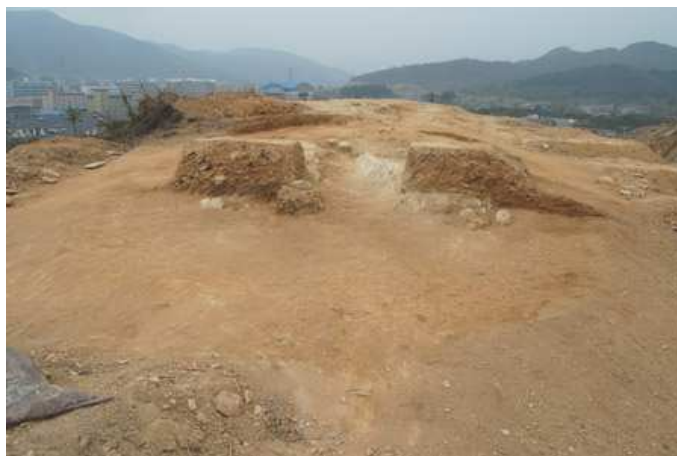
图5 德清小紫山商代晚期土墩

苕溪中下游地区处于东部一马平川的环太湖河网平原与西部高峻的莫干山脉的过渡地带，其流经的区域既有连绵起伏的低缓山丘，也有较开阔的水田与纵横的河流，是古代人类理想的栖息之地，从历年调查材料来看，这一带是先秦时期土墩墓的最重要分布区。数量庞大，分布密集，仅在长兴县一地目前已发现329个地点，共计2840多座土墩，在苕溪两岸的许多低缓山头上，均可见隆起的土墩墓封土。出现时代早、序列完整、种类齐全，最早从夏商之际的马桥文化时期出现，历商代晚期、西周、春秋、战国各个时期。包括平地掩埋型、土坑型、石床型、石圻型、石室型等所有类型的土墩墓。从目前的材料来看，这一带应该是江南土墩墓的起源地，也是中心分布区（图5-图6）。