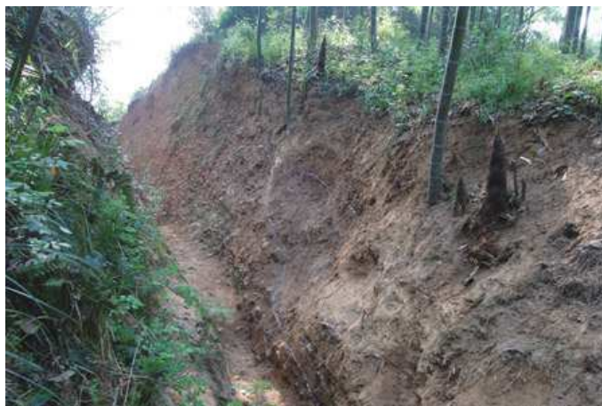
图3 下菰城城墙剖面

下菰城，位于湖州市南郊10多公里处云巢乡窑头村一个自北向南倾斜的山坡上，北靠和尚山，东南临东苕溪。现存内外两重城垣，平面不规则，近圆角三角形，内城位于外城的南侧中部，并利用外城南城墙中段作为内城南城墙。城墙保存基本完好，一般墙高在9米、上部宽5-6米、底部宽30米左右，城墙外有护城河，南城墙外较宽，近30米左右，东西两城墙的内、外城墙仅在南半边有保留，北半边情况不明。城址总面积约68万平方米，其中内城面积约18万平方米。内城南低北高，南边低洼处约占面积三分之一，北边为高台地，低地与高地落差在1米左右（图2）。