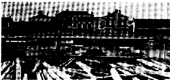
图 1 公济医院(上海市档案馆馆藏档案 H1-1-10-16 上海公济医院。)

1877 年,公济医院迁苏州河北岸虹口头坝渡(今乍浦路桥北)。1927 年,公济医院内添设癆病诊疗所,免费为上海外侨诊疗(上海市档案馆馆藏档案 U1-16-795. 上海公共租界工部局卫生处关于公济医院沿革及发展的文件)。