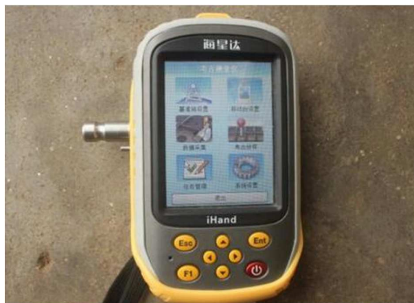
RTK考古放样与数据采集

现阶段试用的考古工地数字化管理平台为一种考古发掘信息化管理系统, 主要是针对传统田野考古信息记录的部分缺陷, 融合空间信息采集、处理、分析技术进行开发研制的。该平台按照国家田野考古规程要求, 在考古发掘过程中采用低空无人遥感、地面三维激光扫描、GPS-RTK、考古田野发掘电子表单等方式实现对考古遗址全方位数字化记录, 为考古人员提供可视化、智能化的考古信息录入、检索、统计分析和报告输出功能, 从而有效提高田野考古信息采集技术水平和工作效率, 并促进考古工地管理的规范化。