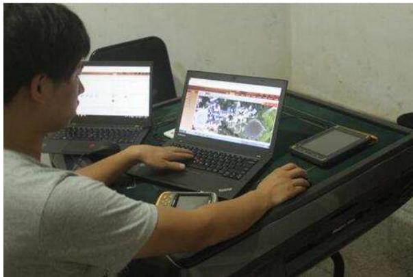
考古工地数字平台测绘数据同步处理