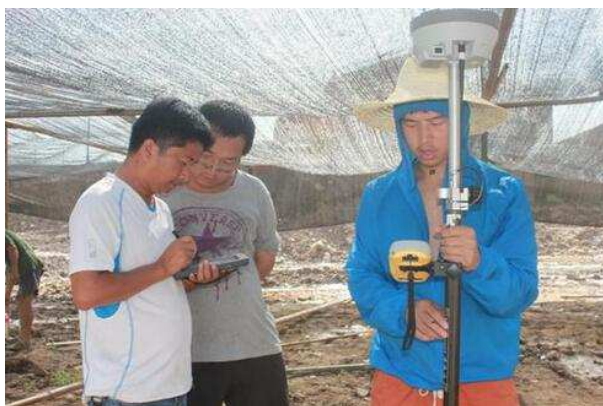
现场信息采集与记录