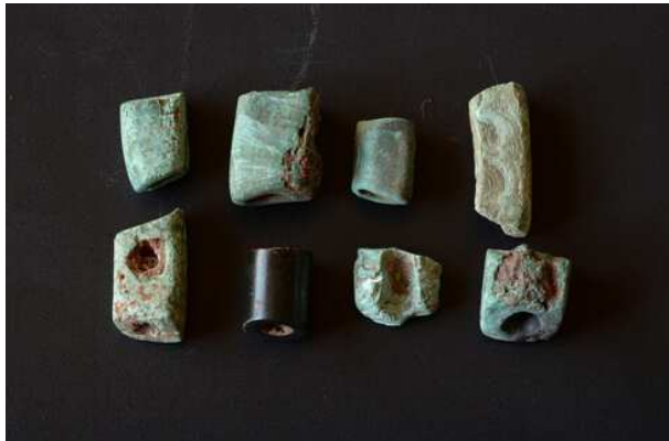
滇文化遗存出土串饰

遗址上部为典型的滇文化遗存。该阶段遗迹仅发现灰坑1座。出土遗物数量较多，发现有铜矿石、青铜器、绿松石珠、陶珠等。根据陶器变化的不同，将滇文化分为早中晚三段，凸弦纹釜贯穿始终。早段仅发现凸弦纹釜残片，中段发现有凸弦纹釜与器壁较薄的折口浅盘共存，晚段发现凸弦纹釜与子母口浅钵共存。