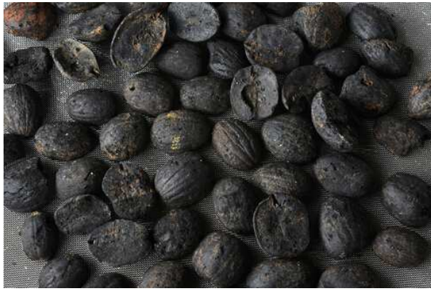
兴义二期遗存出土植物种子