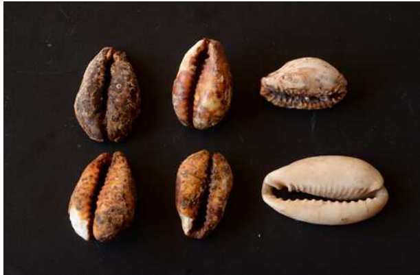
海东类遗存出土海贝

8号墓葬发现有4枚穿孔海贝，其中1枚海贝背部被磨平，推测海贝应作为货币使用。根据出土器物判断，出土海贝的墓葬为海东类遗存，其年代约距今4000年。发现距今约4000年的海贝，为探索南方丝绸之路提供了重要证据。