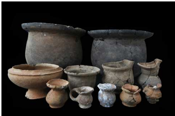
兴义二期遗存出土陶器