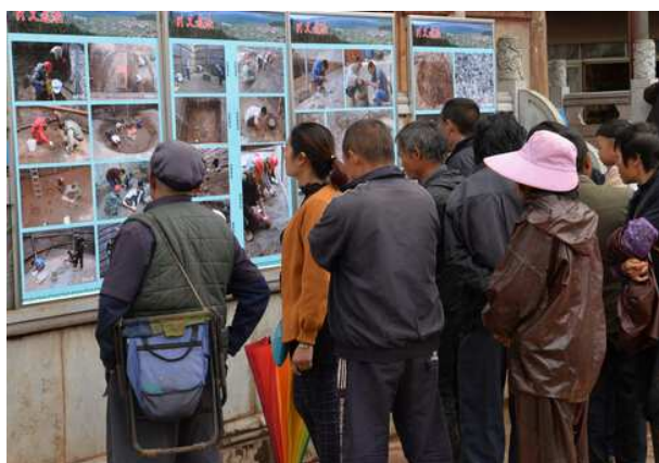
兴义村村民观看发掘展览

作为文化遗产保护与公众考古的一个重要内容，发掘项目组正在发掘地兴义村开展发掘成果展览活动，同时也在与各方协调建议兴义遗址的保护展示问题。