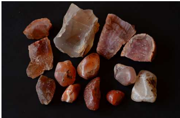
海东类遗存出土玛瑙石

海东类遗存的地层内发现较多玛瑙石、石英石，玛瑙石有砸击痕迹，说明当时已经开始采集加工玛瑙。