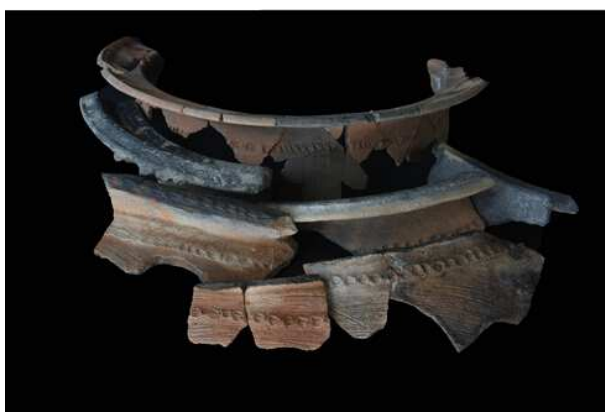
兴义二期遗存出土盘口陶釜口沿

遗存还发现大量网坠、纺轮。网坠以中间粗两端尖的石网坠为最多，同时也发现少量中间穿孔的陶网坠。兴义遗址大量发现的网坠、纺轮与当时织网捕鱼的生业形态是吻合的。除大量水生生物外，遗址内也发现了炭化稻、炭化橡子以及家猪、牛骨骼等，这说明遗址居民的食物来源也有农业种植、家畜驯养及采集等。