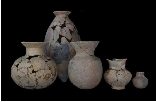
海东类遗存出土陶器

遗迹发现有12座墓葬、3座灰坑及部分柱洞。12座墓葬中除5座（9、10、11、16、20号墓葬）人骨保存不完整外，其余6座（6、7、8、12、13、14、15号墓葬）均为屈肢葬。4号灰坑内发现较多石块、炭屑及动物骨骼等，在灰坑内也发现一具人骨四肢卷曲于胸部，人骨上方压有4块较大的石块。固定采用屈肢葬，表明该人群是一个具有共同信仰的特殊族群，其族属来源需要进一步研究。