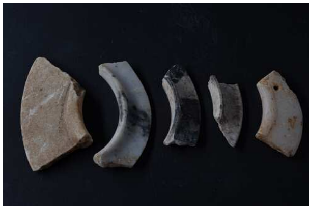
兴义二期遗存出土有领石环

发现有相当数量的有领石环及石钻芯。钻芯为生产石环的废料，有领石环横截面呈“T”字形。