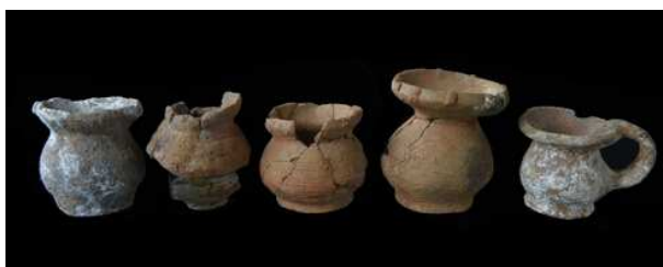
兴义二期遗存出土陶罐