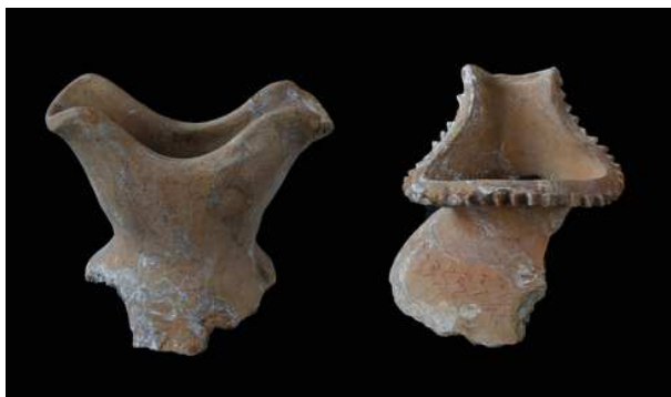
兴义二期遗存出土带流陶器