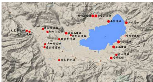
杞麓湖盆地贝丘遗址分布图

同时由玉溪市文物管理所、通海县文物管理所共同开展的杞麓湖区域调查已取得重要收获，在杞麓湖盆地范围内发现贝丘遗址20余处。项目组将择机对这些遗址开展进一步的勘探，以确定这些贝丘遗址的文化内涵及面积规模，为宏观的区域聚落研究积累材料，以期深化杞麓湖盆地的考古研究工作。