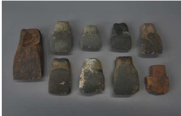
兴义二期遗存出土有肩有段石铤

发现石铤较多，除少量为梯形石铤外，大量石铤为有肩有段石铤。有肩有段石铤常见于东南沿海地区新石器时代及青铜时代遗址。