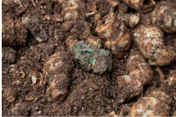
兴义二期遗存出土铜矿石

5、遗物：遗存发现有相当数量的孔雀石、炼渣、石范、青铜器，说明当时人已经开始采铜冶铜生产青铜器，该遗存属于青铜时代遗存，遗存的发现将滇中青铜时代的上限提前至商时期。