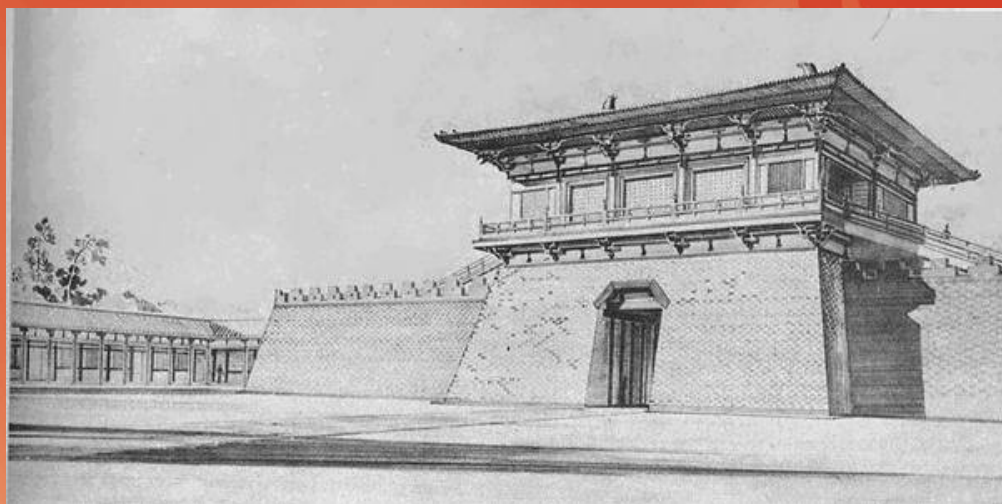
唐大明宫玄武门复原图