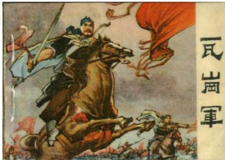
瓦岗军起义 程咬金