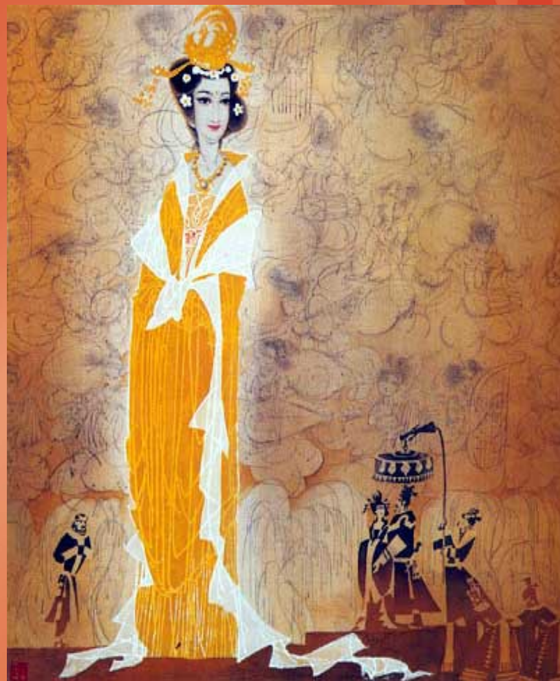
南朝陈后主妃张丽华