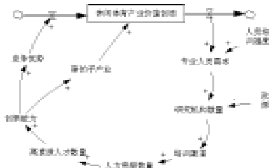
图2 上海市休闲体育产业价值创造中的人才流 Figure 2 Talents Flow in the Value Creation of Shanghai Leisure Sports Industry

人才流中的人才主要指高素质体育产业管理者、专业从业人员和职业技能人员等人力资源的积累与利用(见图2)。如：体育赛事运作、组织、管理人才，体育培训人才，体育经纪人等等。