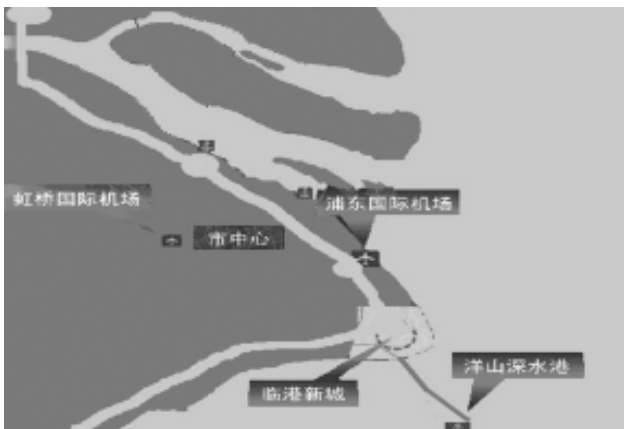
图1 上海沿海大通道示意图 Figure 1 Major Thoroughfare along the Coast of Shanghai

用，其经济发展前景有很大空间，这也为临港新城体育产业的发展提供了更广阔的发展空间。