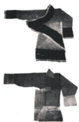
图5:长沙马王堆一号汉墓出土的袍服 上:信期绣锦缘绵袍 下:印花敷彩纱绵袍

工加以区分,从色彩和款式上区别不大,另外画中所出现成人袍服领袖皆为黑缘边,而两个男孩则未用黑色的领袖缘边。东汉时,基本都用直裾袍,而且官民款式不分,不同官级间款式也无大的区别,但从出土实物中可以看出,身份越是高贵的人袍的长度一般会越长。