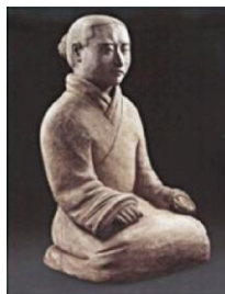
图1:秦始皇陵穿袍跪俑侧面 (秦始皇陵博物院藏)

秦代服饰是战国服饰的延续,秦代历时十五年,袍服没有太多的改变。秦代的出土资料很有限,主要集中在秦始皇陵周围,其中最具代表性的就是秦陵兵马俑,兵马俑真人大小,制作写实,细节也很清楚。图1、2为秦始皇陵穿袍跪俑,跪俑穿右衽袍,长至膝盖以下,中衣领围在颈部,如围巾样,可以起到保暖的作用,交领,窄袖,腰间系带。图3为秦始皇陵马厩出