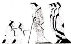
图8:《升天图》局部 (长沙马王堆一号汉墓出土)

《释名》云:“妇人以绛作衣裳,上下连四起施缘,亦曰袍。”如图5上,由此可见那时的袍还有衣裳相连属之式,男女皆穿袍。汉代的常服也是以袍为主。另外,长沙马王堆一号汉墓中的曲裾袍可以证明,有方领、曲裾、衣襟下达腋部即旋绕于后。汉代袍主要有三个特点:一是有里有表或絮碎麻、丝绵称夹袍或绵袍。二是多交领、大襟、右衽,袂宽,祛窄。三是领口、袖口处绣纹样。袍的长短也不一样,文官长着袍长至踝骨或盖脚面,武将或劳动者袍长过膝处。《后汉书·舆服志》载:“通天冠,其服为深衣制。随五时色,近今服袍者,下至贱更小吏,皆通制袍、单衣,皂缘领袖中衣为朝服。” [2] 袍在汉时开始作为衬衣当做朝服组成部分出现。东汉永平二年(公元59年)开始将袍定制为朝服,