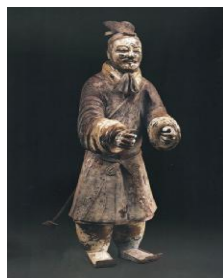
图4:秦始皇陵车驭手俑 (秦始皇陵博物院藏)