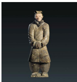
图3:秦代官员俑 (秦始皇陵博物院藏)

土的秦代养马官员俑,穿右衽短袍,袍内还穿有一件袍,袍为交领,窄袖,大襟,无开叉,腰间系带,袖口紧收。图4为秦始皇陵车驭手俑,在马车上站立驾车,头戴冠,右衽交领长袍,腰间系细带,并在前面打结,大襟,窄袖,无开叉。从