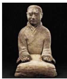
图2:秦始皇陵穿袍跪俑正面 (秦始皇陵博物院藏)

土的秦代养马官员俑,穿右衽短袍,袍内还穿有一件袍,袍为交领,窄袖,大襟,无开叉,腰间系带,袖口紧收。图4为秦始皇陵车驭手俑,在马车上站立驾车,头戴冠,右衽交领长袍,腰间系细带,并在前面打结,大襟,窄袖,无开叉。从