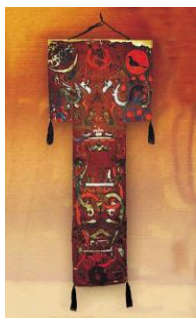
图7:帛画《升天图》 (长沙马王堆一号汉墓出土)