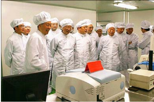
院士们来我院参观

经教育部、国家外国专家局批准的“宽禁带半导体与微纳电子学”创新引智基地，是“十二五”首批高等学校学科创新引智基地，基地汇聚了海外 11 位一流学术大师，为研究生国际学术交流和联合培养提供了优越的环境。