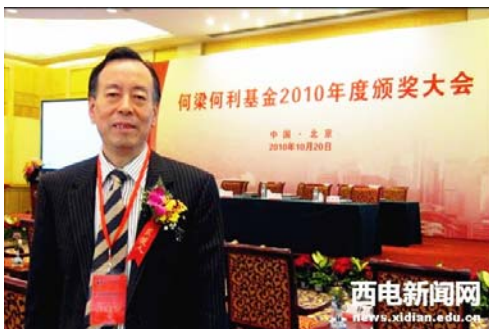
郝跃教授荣膺中国科学院院士

学院师资力量雄厚，中青年教师队伍实力在全国高校同类专业中名列前茅。现有博士研究生导师20人，硕士生导师49人。拥有中国科学院院士1人、双聘院士1人，有“何梁何利基金科学与技术进步奖”获得者1人、“国家杰出青年科学基金”获得者1人、“国家有突出贡献专家”1人、国家“百千万人才工程”及“新世纪百千万人才工程”2人、“跨世纪优秀人才计划”入选者1人、教育部新世纪优秀人才支持计划入选者2人、陕西省“三五人才”3人，陕西省教学名师1人。拥有陕西省教学团队1个，国防科技创新团队1个、校级科技创新团队2个。目前在校研究生800余人。