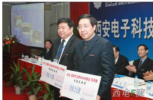
杨银堂教授荣膺国家杰出青年科学基金(西电首批)