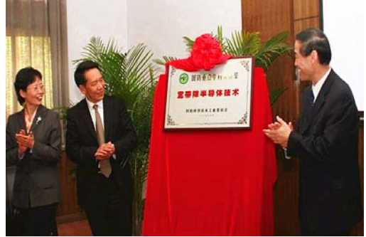
国家重点实验室挂牌仪式

集成电路实验教学中心是国家级实验教学示范中心，设有超净工艺实验室、EDA 中心、创新实践实验室和专业基础实验室等。实验室场地总面积达 4400 平方米，仪器设备总价值近亿元，为学院的人才培养、学科建设、科学研究提供了良好的设施和条件。