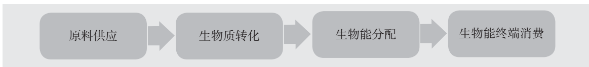
图3 美国生物能源技术办公室 (BETO) 示范和部署工作范围

对于生物燃料，BETO 示范和部署的目标是：建立从小试规模到预先商用规模的新兴转化技术，最终由产业来建造最早的生物燃料生产厂。BETO 与其他联邦机构合作，促进在全美国范围内将生物燃料配送基础设施和生物燃料兼容汽车投入市场，并扩大所占市场份额。BETO 这些示范和部署工作与生物质到生物能源供应链一致，其工作范围如图3所示。