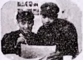
军区电影放映队的同志正在制做幻灯片，宣传计划生育。

电视片《一个好》，向观众介绍了省军区如何搞好计划生育工作以及先进单位和个人事迹。电视台于4月15日播映。