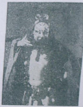
袁世海饰《野猪林》中的鲁智深。

著名京剧演员袁世海形象，鲜明地表达出人物在特定环境中的思想感情和性格气质，富于生活气息。电台6月17日17:00将专题介绍袁世海的唱念艺术。