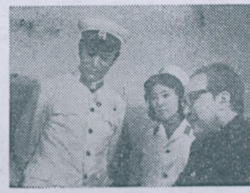
《魔影》剧照 (江苏电视台供稿)

猪肉是大家常用的食品。食用猪肉时，人们往往将肉皮随手扔掉。其实肉皮的营养价值很高，含有丰富的蛋白质、脂肪和碳水化合物。肉皮经过一些技术处理，可制成美味可口的菜肴。十九日九频道《生活顾问》节目介绍。