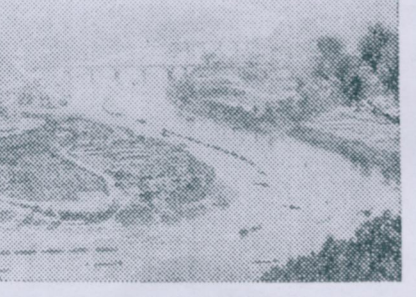
绕城而过的浏阳河

在浏阳县东北一百三十华里的地方,有一座巍峨的大山,叫圣人山。传说远古时代的大禹带着他的助手应龙、玄龟,在这里餐风露宿,与恶龙搏斗,降服洪水。圣人山的名字也由此而来。 这个神话反映了人民征服自然的愿望。但在解放前,这里洪水成灾。解放后,在党的领导下,浏阳人民组织起来兴修水利,在圣人山一带建起了一个大型水库,叫深子湖,能发电、养鱼,灌溉面积十八万多亩,水害终于被人民征服了。电台《湖南各地》节目17日18:40播送电台通讯员范庆凡写的游记,详细介绍圣人山。(18日11:30重播)。