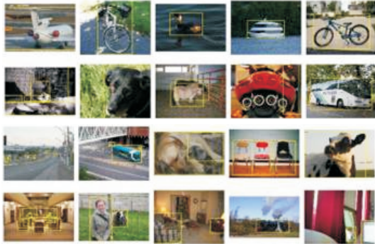
图2 PASCAL 数据库图片

目前, 目标检测研究常用的数据库有PASCAL VOC数据库 [49-52] 、UIUC汽车数据库、LabelMe数据库和INRIA行人数据库. 其中PASCAL VOC数据库(图2)是近几年目标检测算法最权威的数据库之一. 而INRIA行人数据库(图3)则是目标应用较多的行人数据库, 其主要应用于直立行人目标检测的研究.