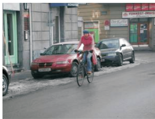
图3 INRIA 数据库示例图片