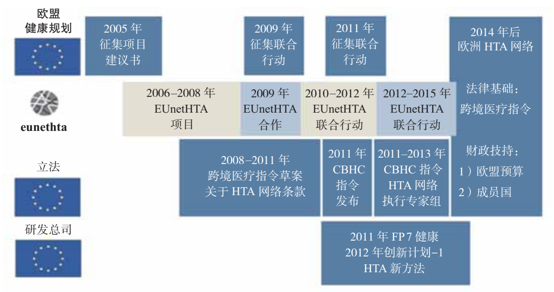
图 4 欧洲卫生技术评估网络发展阶段[5]

2012 年底后,EUnetHTA 项目以上述指令作为立法基础,启动第二期联合行动计划——欧盟资助以 EUnetHTA 项目为基础最终形成欧盟国家永久性自愿参加的卫生技术评估网络。欧洲卫生技术评估网络发展见图 4 所示。