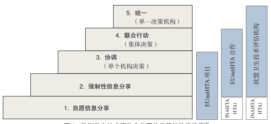
图 3 欧洲卫生技术评估合作网络发展的阶梯路径[4]

为此,在欧洲一体化的大背景下,共同建立统一的欧洲卫生技术评估网络,成为一项结合科学、政治特性的务实选择,其最终目的是创建一个有效和可持续的遍布欧洲卫生技术评估网络,开发和使用实用性工具,促进向欧盟成员国和欧洲经济区国家的卫生技术评估部门提供可靠、及时、透明、可交换信息。从理论和发展路径角度,有欧洲学者提出横跨欧洲的卫生技术评估合作机制的实现可分为5个层级或步骤,如图3所示。