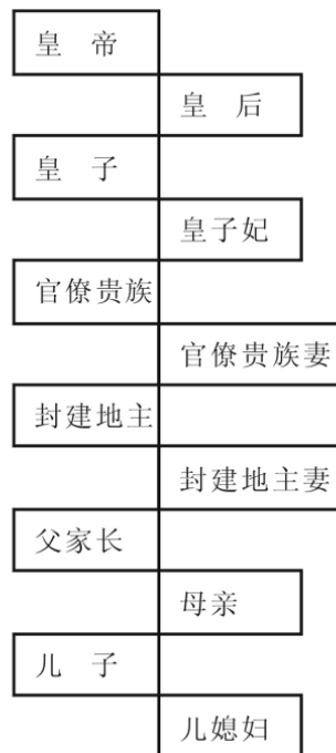
图1 古代父权制社会等级结构图

父权制等级社会实际的社会关系要比上述结构图复杂得多（如嫡庶关系、亲疏关系等均没考虑进去）但大致呈这样的拉链式等级次序。在每个等级中，男性地位都比女性高。但也要清楚，男尊女卑只存在于血缘等级和政治等级内的比较之中。也就是说，男女不平等，是在等级内的比较相对而言。等级地位较高的人对等级地位较低的人具有支配权力，等级地位低的人在高于他们的所有等级的人面前必须卑躬屈膝。处在较高地位的女性，同样拥有对较低地位的所有男性和女性的支配权。不存在超越等级鸿沟的性别不平等。