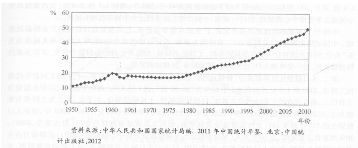
Figure 1 Trends in China's Urbanization, 1950 to 2010

第一,人口城镇化滞后于工业化。国际经验表明,城镇化率与工业化率合理比值为1.4~2.5(赵文丁,2003),2010年我国为1.06 ① ,尚未进入合理区间。投资拉动型主导的发展方式,过早追求发展资本密集型产业,出现了资本替代劳动的趋势,同时服务业发展滞后,导致“高增长、低就业”,就业弹性逐年下降,由“九五”期间的0.14下降到“十五”期间的0.12,2008年仅为0.08(易鹏,2009),是发展中国家平均水平的1/4和发达国家的1/6 ② ,使得城镇吸纳劳动力及人口能力不足。