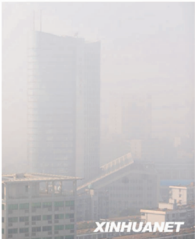
图2 武汉雾霾天气(东湖,2009-01-31) [3]