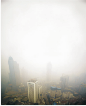
图1 南京雾霾交织天气(2007-09-11) [2]