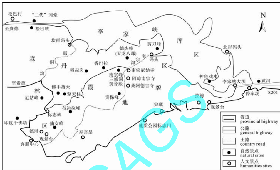
图 2 坎布拉地质公园主要旅游景点分布示意图