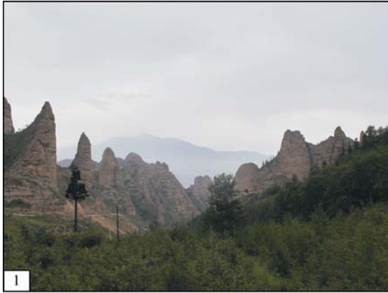
图版 I Plate I