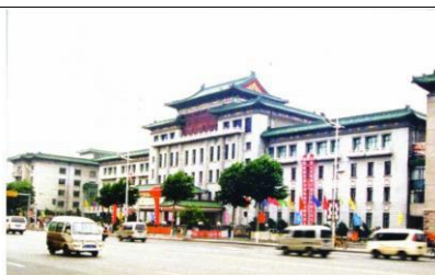
图 8 哈尔滨友谊宫