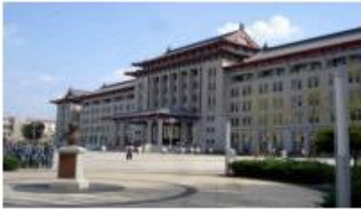
图 23 2007年竣工的 21#教学楼