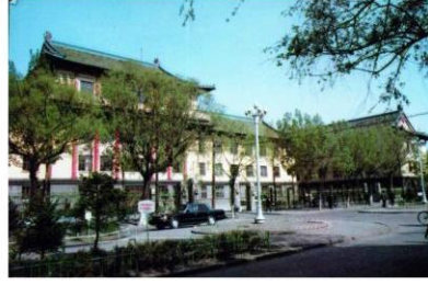
图 10 中共哈尔滨市委办公楼

巍巍雄姿的五栋教学楼成就很高。砖混结构,仿中国传统建筑风格,端正严谨,形态庄重。歇山顶组合屋面、檐下有斗拱和蚂蚱头、台基、栏杆、抱鼓、雀替、彩绘均为清式。整个建筑稳重、色调淡雅,在彩绘的衬托下,沉稳中又不失轻快活泼。大红色的门廊柱与灰色系背景构成鲜明对比,突出主入口的形象。各具特色的大厅、精雕细刻的装饰细部……。这是一组把传统形式完美的用在现代建筑的典范。但是,建筑构图却