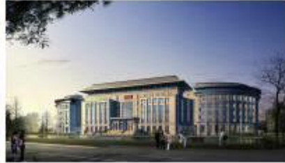
图 24 2009年新建图书馆渲染图