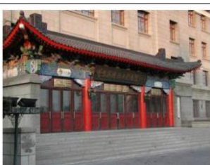
图 18 3#楼海军工程系入口