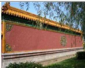
图 5 文庙的照壁