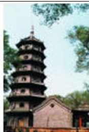
图 2 极乐寺佛塔