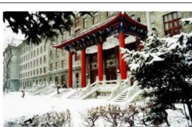
图 14 1#楼空军工程系主入口