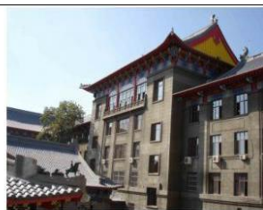
图 19 4#楼装甲兵工程系院内

哈尔滨工程大学(哈军工)教学楼处在极乐寺和文庙的中国传统建筑文化的文化圈区域, 在南岗区南通大街, 马路对面与之相望(新建筑遮挡视线)的就是中国传统建筑形式的极乐寺、普