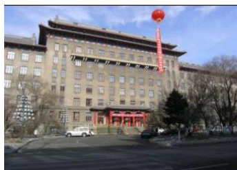
图 15 2#楼炮兵工程系