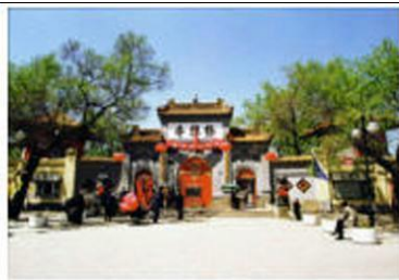
图 1 极乐寺山门