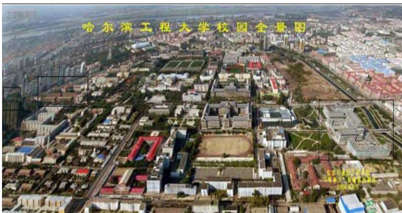
图 21 哈尔滨工程大学校园鸟瞰(2006年)

哈尔滨工程大学(哈军工)老校区教学楼是中国传统建筑的装饰语素,清式的台基、栏杆、抱鼓……和自身独特的屋顶瓦饰。但是总体上,建筑仍是西洋建筑的构成方式,呈现出横三段、竖五段的构图,是对中西风格融合的一种追求。试想将屋顶形式改为女儿墙,歇山顶改为山花,就会变成完全西化的建筑外表了。