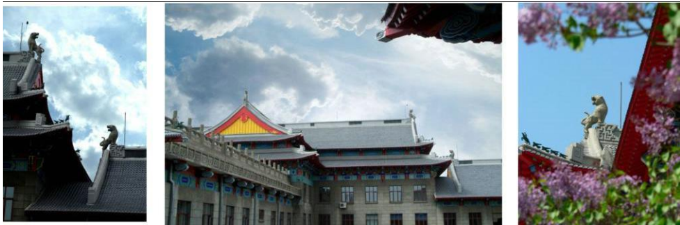
图 11 教学楼丰富变化的屋顶

各个系的大屋顶正脊上不是龙头鸱吻,而是一只回头望月的上山老虎,昂首翘尾、威武有气势。仙人骑鸡取而代之一个将军骑马,走兽由不同武器模型取代,飞机、大炮、军舰、坦克等作为各系教学楼的识别标志。军工大院的雄伟建筑在当时可以说在哈尔滨首屈一指 [3] 。