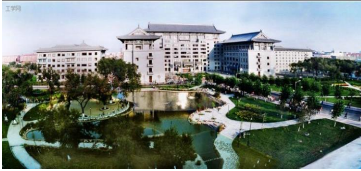
图 22 2003年竣工的 #楼学校机关