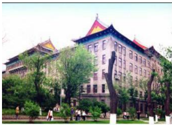
图 13 1#楼空军工程系