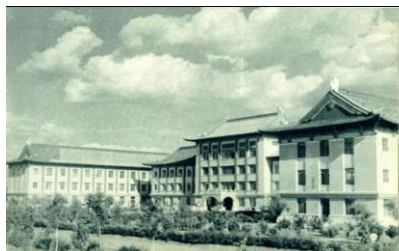
图 7 哈尔滨医科大学

哈尔滨工程大学的前身是哈尔滨军事工程学院, 老校区的五栋建筑被市政府确定为哈尔滨二类保护建筑, 属于建国初期带有前苏联印记的社会主义内容与中国传统形式相结合的建筑, 作为哈尔滨建筑历史文化遗产, 至今仍是哈尔滨城市建筑艺术魅力的一个重要组成部分。