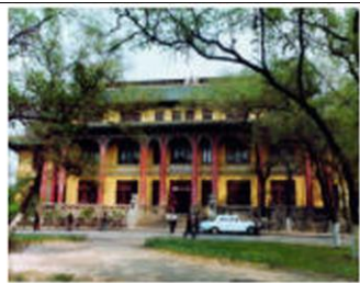
图 3 哈尔滨第三中学

整座文庙以大成殿为中心, 南北形成一条中轴线, 结构为南北向三进院落。从南端的影壁墙向北, 经泮池、泮桥、棂星门、大成门至二院大成殿形成高潮, 最后收尾于三院的崇圣祠。大成殿等级之高超越了文庙所属的等级, 重檐庑殿顶, 十一开间, 金色琉璃瓦, 和玺彩画, 竟与北京故宫