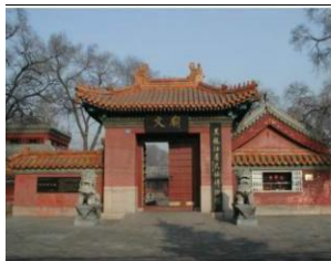
图 4 文庙入口

太和殿的型制一致。东西牌楼、两院、掖门、石碑等则基本均衡, 对称坐落在中轴线两侧, 三进院落落在中轴的贯穿下, 层递进, 有起点, 有续尾, 抑扬顿挫, 一气贯通。继续不断地空间序列, 起伏有致。整体建筑群黄瓦红墙, 金碧辉煌, 雄浑博大, 属典型的清代建筑风格。