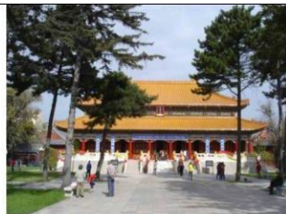
图 6 文庙大成殿