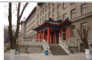
图 16 2#楼炮兵工程系入口

1#楼总面积 4 7万平方米, 主体高五层, 局部高六层。总体布局为“日”字型。