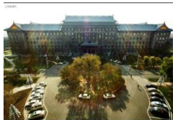
图 17 从 2#楼看对面的 1#楼教学楼

装甲兵工程系的 4#楼和工兵工程系的 5#楼面积都是 1 6万平方米, 整体高四层, 加正中带柱廊的顶楼为五层。东面的 4#楼, 也是“日”字型的布局, 而西面的 5#楼, 布局与 3#楼相同。三栋楼东、西、北品字型围住边长千米的大操场, 举目环顾, 巍峨壮美、气魄非凡, 令人一见难忘。