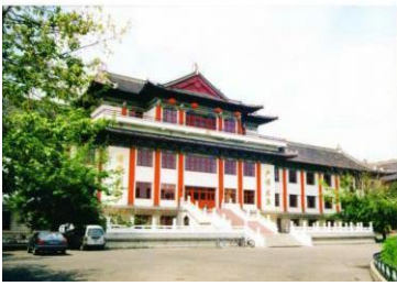
图 9 国家地震局力学研究所