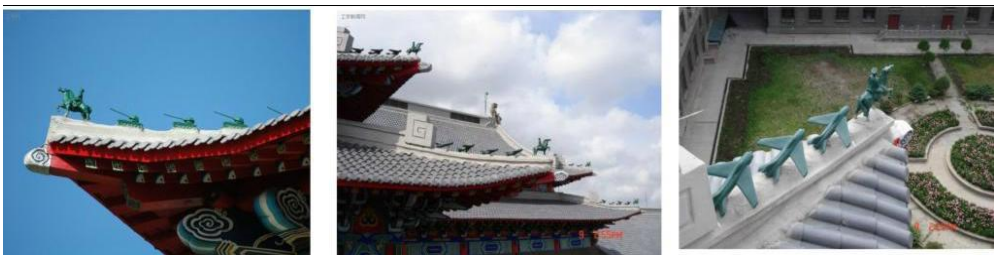
图 12 教学楼屋顶的瓦饰

一直以来,1#楼都被认为是我国著名的建筑学家梁思成先生手笔。但是,查找资料没有是梁思成先生设计的记载。