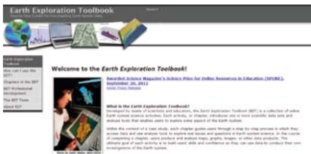
图1 Interlib图书馆集群管理系统体系架构图