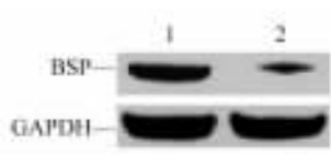
图 1 231BO-BSP27 细胞中 BSP 蛋白表达下调 Fig. 1 Decreased expression of BSP protein in 231BO-BSP27 cells

Western blotting 检测结果显示, 与 231BO-Scrambled 细胞相比, 231BO-BSP27 细胞中 BSP 蛋白水平明显降低, 其抑制率达到 ( 74.32 \pm 2.18 )% (图 1, P < 0.01 )。