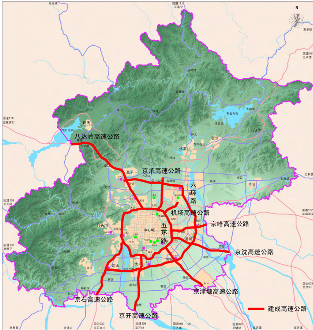
图 10-2 2004 年高速公路网图