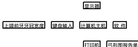
图 1 个体理想牙弓弓形计算机绘制系统的组成和流程图

tium166 或兼容 CPU,内存 32M,硬盘 1G。彩色显示器,分辨率 800 ×600。 Windows 支持的黑白或彩色打印机。