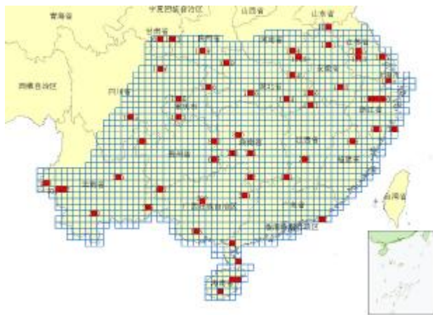
图 3 我国大陆广州管圆线虫病抽样调查点分布 Fig.3 Distribution of the sampled survey sites for Angiostrongylus cantonensis in China

生物中，小管福寿螺和褐云玛瑙螺都名列其中。褐云玛瑙螺虽然也是广州管圆线虫的重要中间宿主，但它是陆生软体动物，其分布范围及其扩散速度相对受到限制。本研究结果表明，选取扩散速度快及分布范围广的小管福寿螺作为广州管圆线虫病传播媒介的代表更具实际意义。