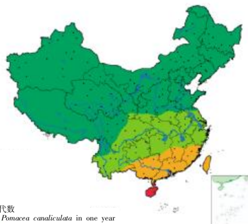
福寿螺发育历代数 Generations of Pomacea canaliculata in one year 一年内不能完成一代 <1 generation in one year 一年内可以完成一代 1 generation in one year 一年内可以完成二代 2 generations in one year 一年内可以完成三代及三代以上 ≥3 generations in one year