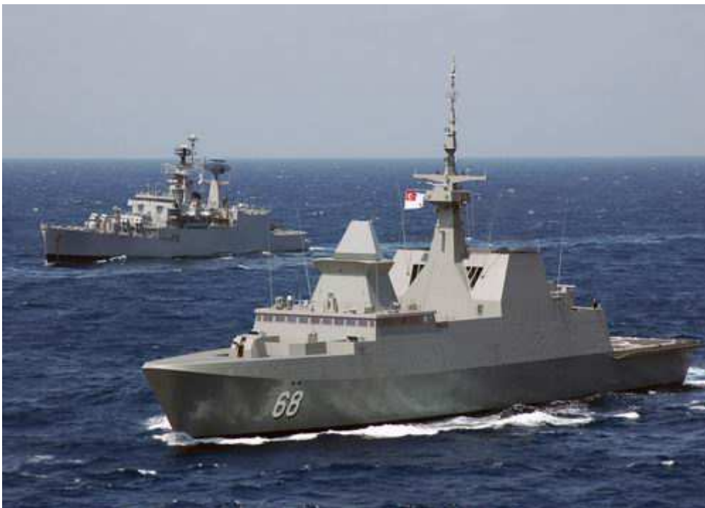
新加坡“可畏”级护卫舰 [资料图]

“可畏”级护卫舰的舰艏装备有一门奥托·梅莱拉 76 毫米口径速射舰炮，该炮射速为 120 发/分钟，射程 16 公里；前甲板还有 4 套 8 单元法国“席尔瓦” 垂直发射系统 ，可装备 32 枚“紫苑”15/30 型防空导弹；中部的“半埋式”区域装有 8 枚美制“鱼叉”导弹，作为反舰作战的主力装备；后部还设计有机库和起降平台，可搭载一架 S-70B“海鹰”反潜直升机。作为新加坡最大的水面舰艇，“可畏”级护卫舰整体性能优异，称的上是东南亚地区最先进的水面舰艇。装备该级护卫舰后，新加坡海军也开始拥有远洋作战能力。