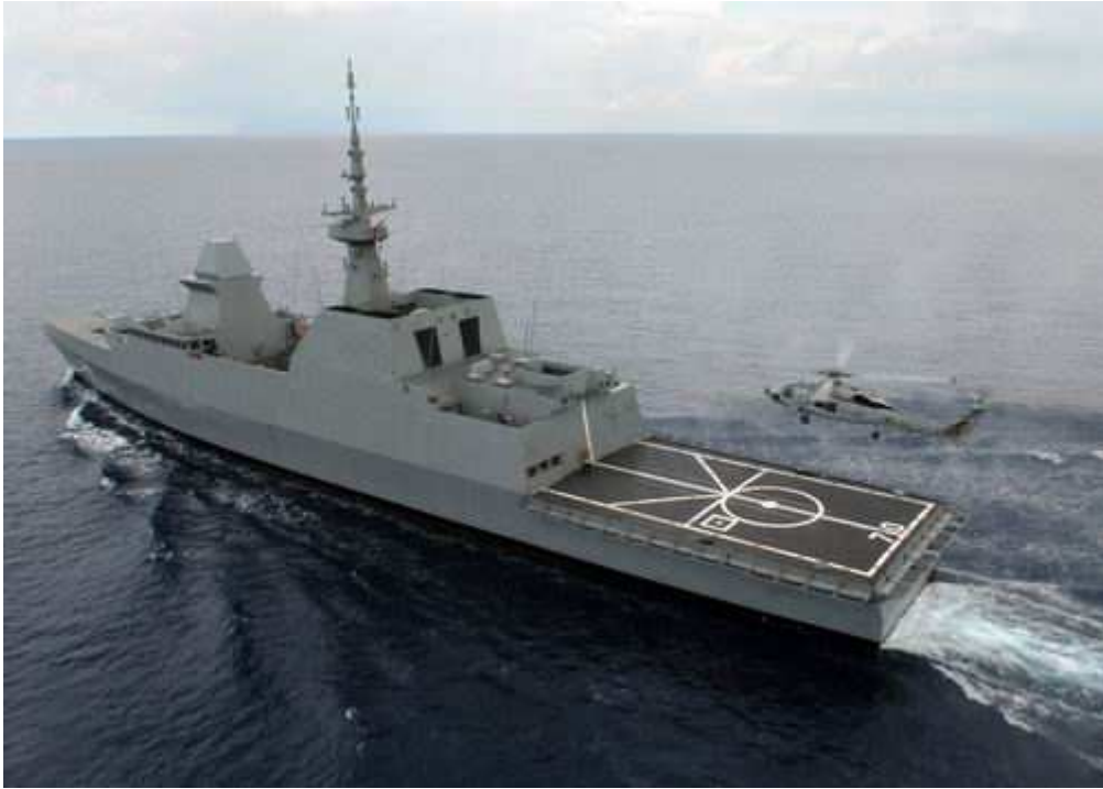
新加坡“可畏”级护卫舰 [资料图]