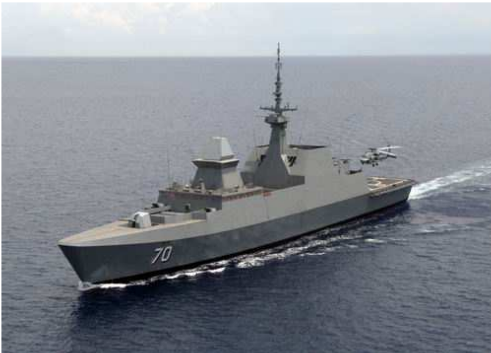
新加坡海军“无畏”级护卫舰第三艘“坚定”号 (Steadfast, 舷号 70) [资料图]