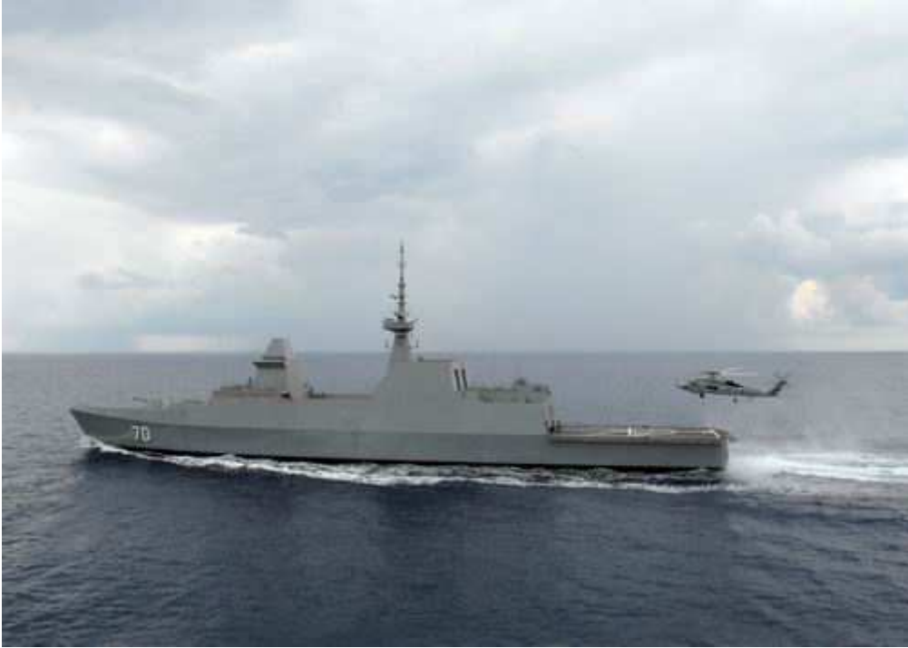
新加坡“ 可畏 ”级护卫舰 [资料图]