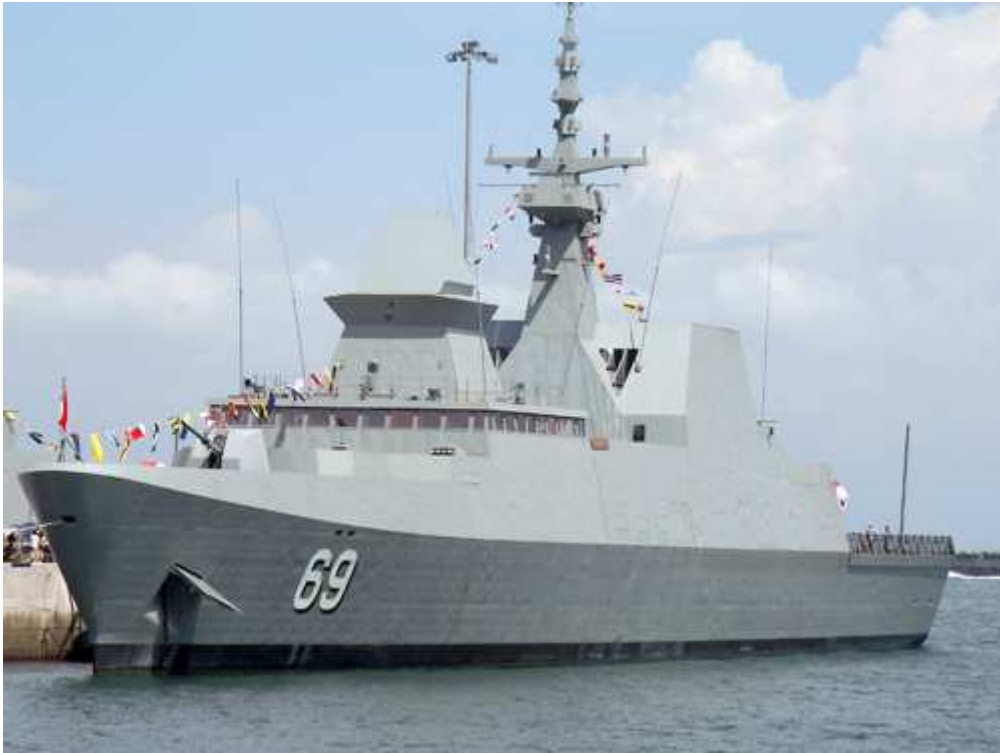
新加坡海军“无畏”级护卫舰第二艘“刚毅”号 (Intrepid, 舷号 69) [资料图]