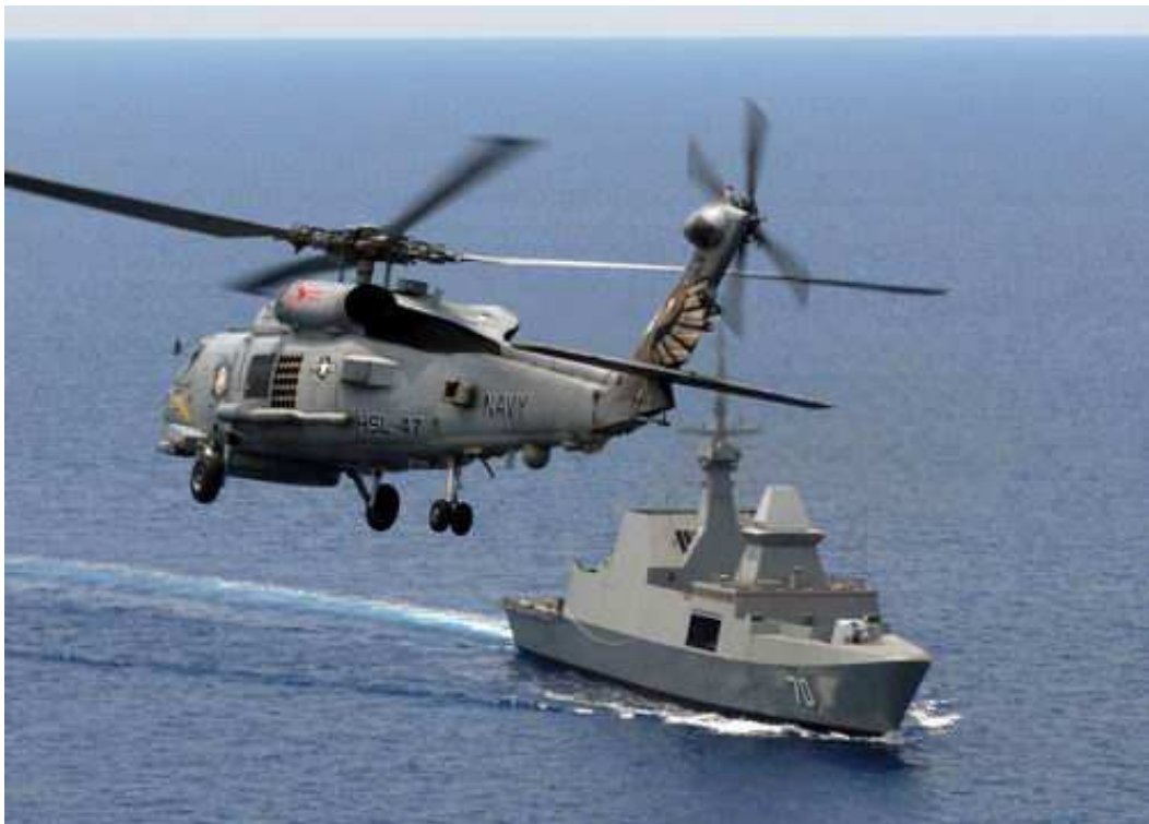
新加坡“可畏”级护卫舰 [资料图]