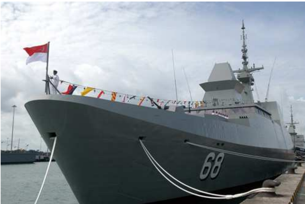
新加坡海军“ 无畏 ”级 护卫舰 首舰“ 无畏 ”号 (Formidable, 舷号 68) [资料图]