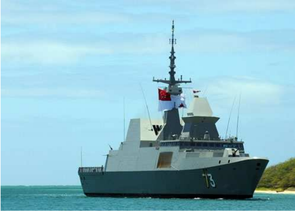
新加坡海军“无畏”级护卫舰第六艘“无比”号 (Supreme, 舷号 73) [资料图]