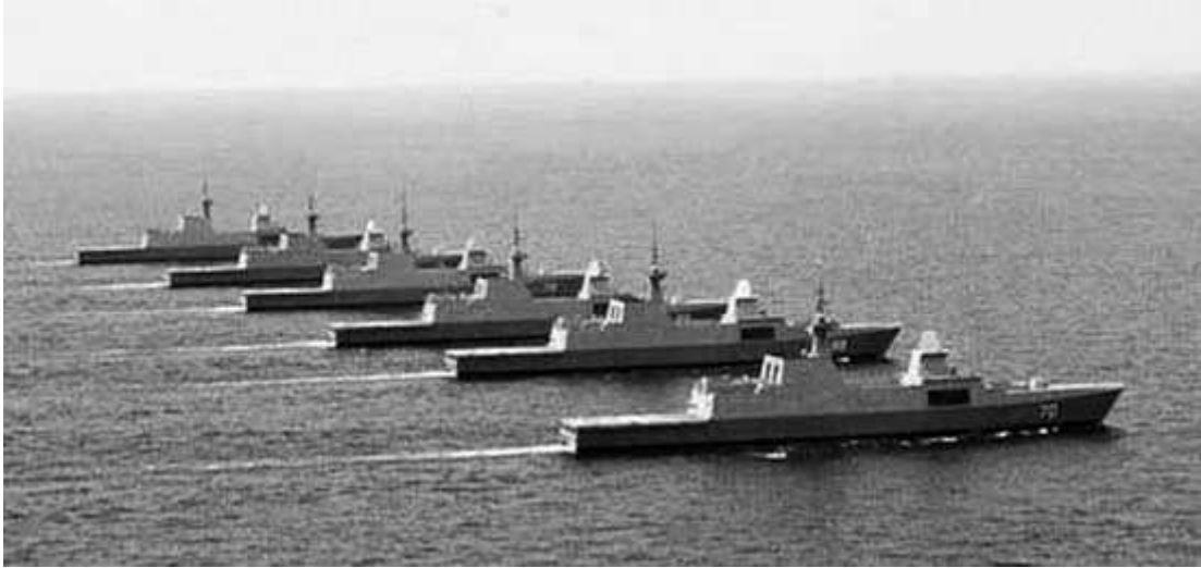
新加坡海军的6艘“可畏”级护卫舰集中亮相