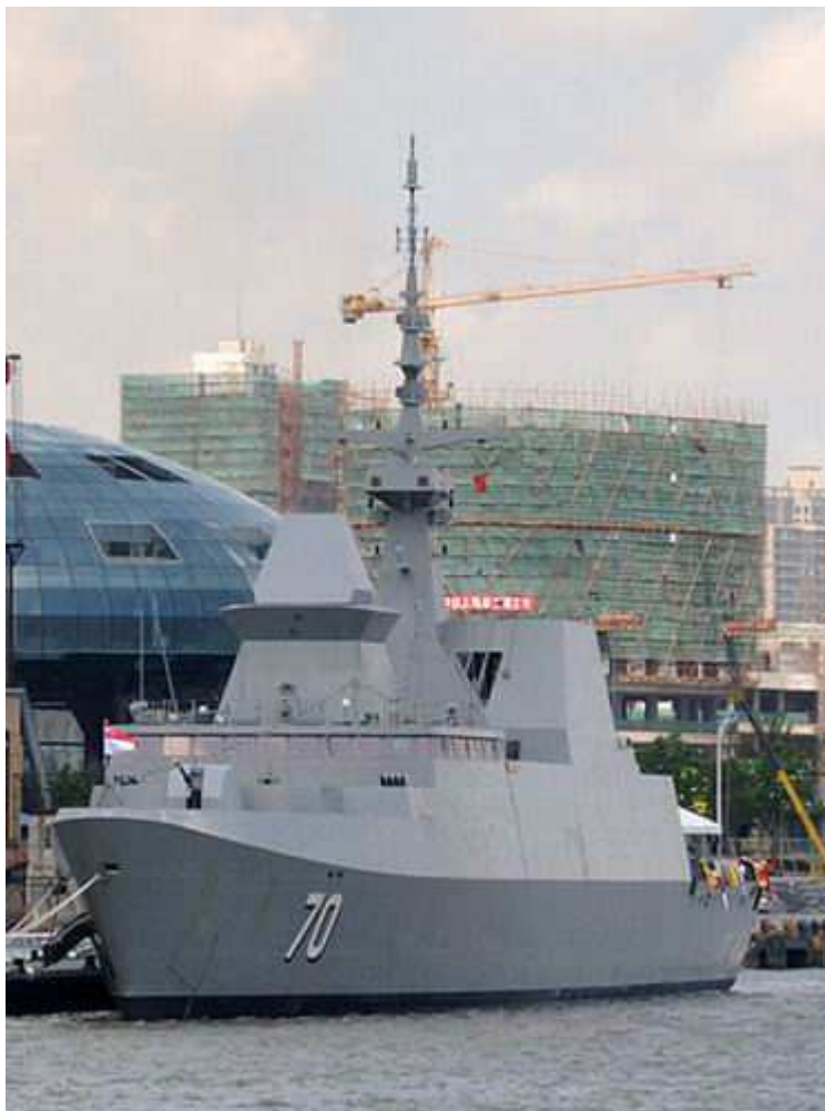
访问中国上海的新加坡“ 可畏 ”级隐身护卫舰 [资料图]

由于国土面积狭小，新加坡一直希望通过加强海空军事实力拓展本国的防御空间。在装备“ 可畏 ”级护卫舰以前，新加坡海军的水面舰艇主力大都为轻型护卫舰（大型导弹艇），不仅作战能力有限，而且难以在远海长期部署。“可畏”级护卫舰加入新加坡海军后，可加强对周边海域的监控能力，有望一步拓展其海上防御空间。（记者/东阳）