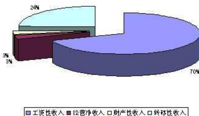
图1 1-3季度海淀四大类收入构成 (单位:元)

从四大类收入来看，1-3季度人均工资性收入19701.60元，同比增长14.55%，是可支配收入的主要来源；人均转移性收入6926.05元，同比增长6.29%，其中人均养老金或离退休金6243.80元，同比增长12.00%。