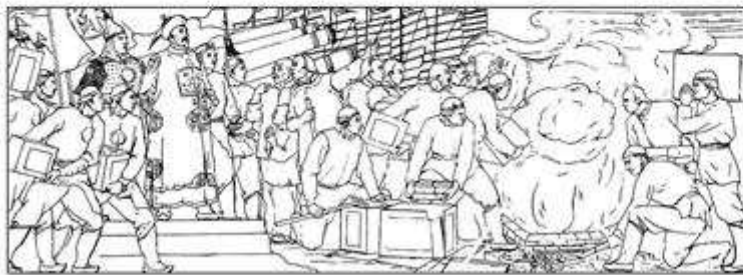
人民英雄纪念碑浮雕局部—虎门销烟