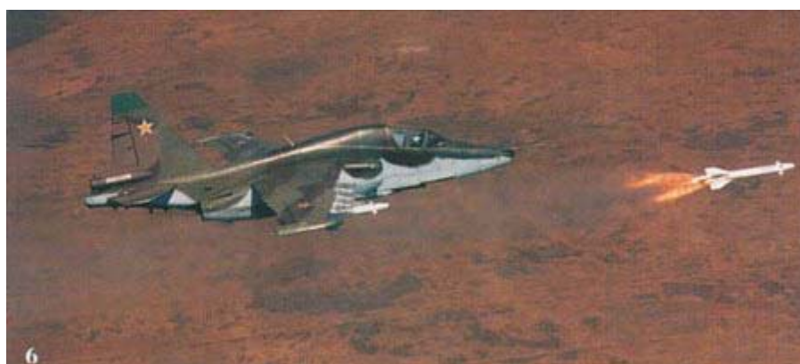
苏联制造 AS-12 反辐射导弹 [资料图片]