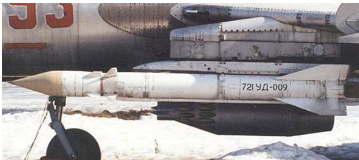
苏联制造 AS-12 反辐射导弹 [资料图片]