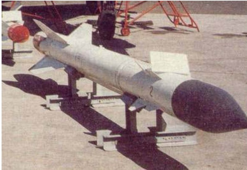
苏联制造 AS-12 反辐射导弹 [资料图片]

这两型导弹是星辰设计局由现有的系统改进发展而成，主要是作为 Kh-28 导弹 的 后继系统 ，由于它的重量较轻，使得搭载母机能从低空发射，搭载母机因而可获得较佳的作战存活性。Kh-25MP 属于俄制第一代战术反辐射导弹，其技术层次约略与美制百舌鸟（Shrike）导弹类似，性能已不敷现代作战所需。