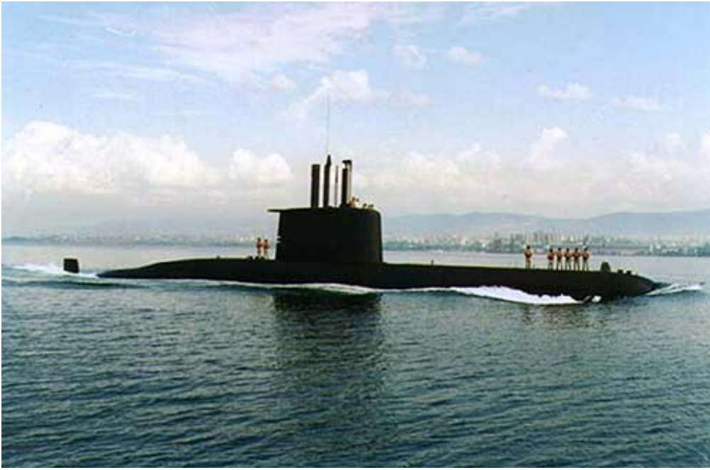
209 型潜艇 [资料图片]