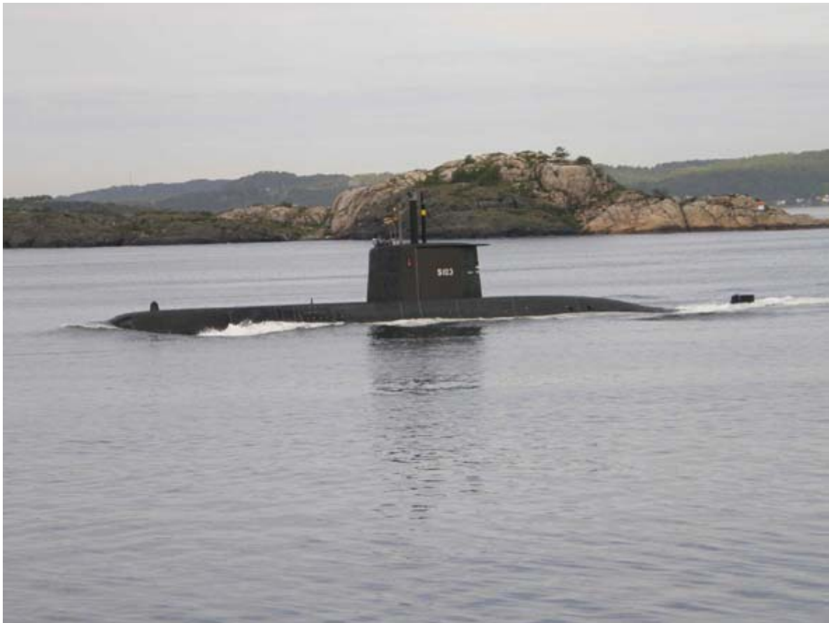
209 型潜艇 [资料图片]