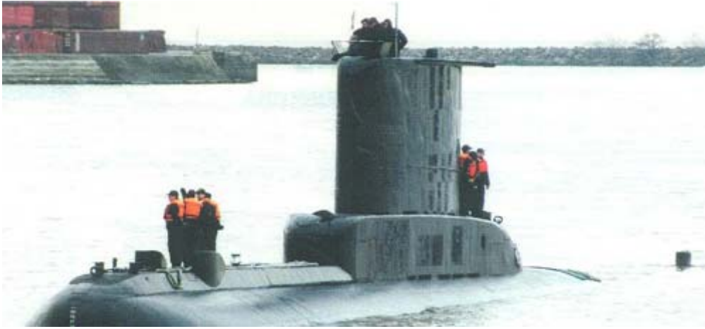
209 型潜艇 [资料图片]