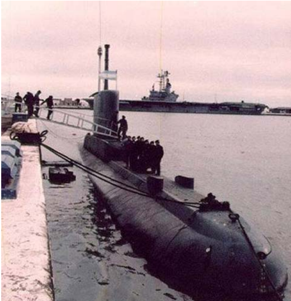
209 型潜艇 [资料图片]