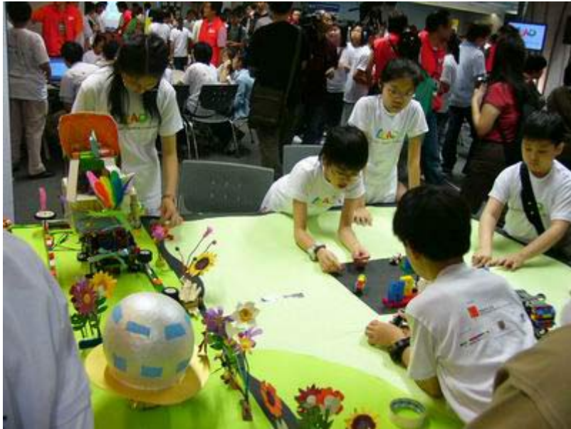
图为：学生正在进行作品设计