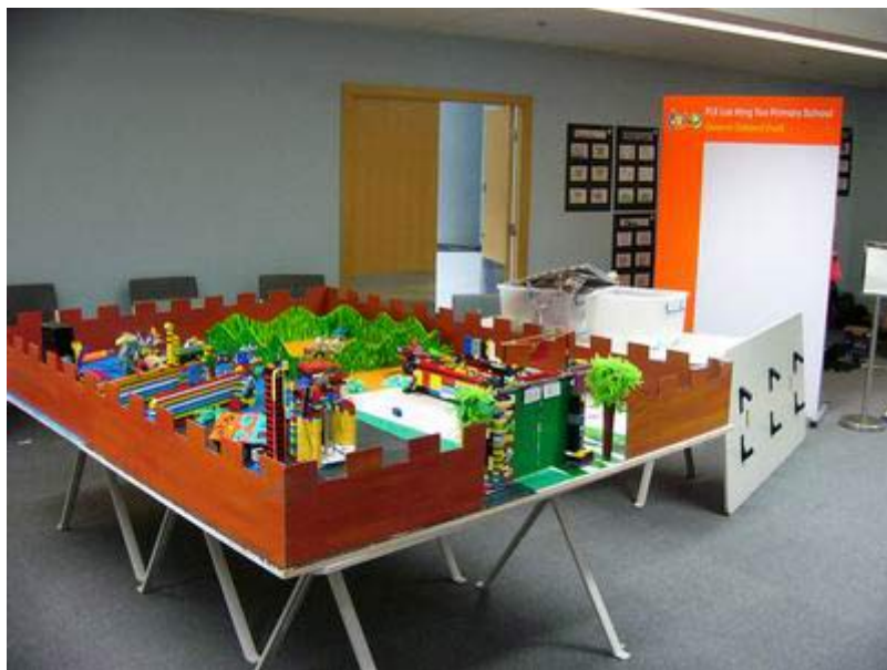
图为：终身教育研究项目的学生设计的作品

而我认为这个阶段正是电脑应该大显身手、彻底改变这种现状的时候。电脑可以让我们利用新技术，重拾幼儿园时期的学习方式，让各个年龄层次的人都能通过设计性活动进行学习。应用得当的话，电脑可以为你提供更为广阔的设计空间。你的设计活动不再局限于堆沙堡、搭积木，电脑可以让你设计很多东西，启发你产生更多想法，帮你完成复杂的项目，教你理解更加复杂的概念。这就是我们想做的事情：用从幼儿园得来的启示，结合新的材料和技术，让更多人可以继续他们在幼儿园时期的学习方法。这是为什么我们这个研究小组的名字是“终身幼儿园”。