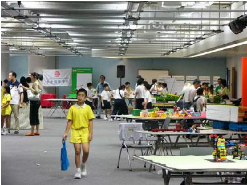
图为：在香港进行的研究项目现场全景