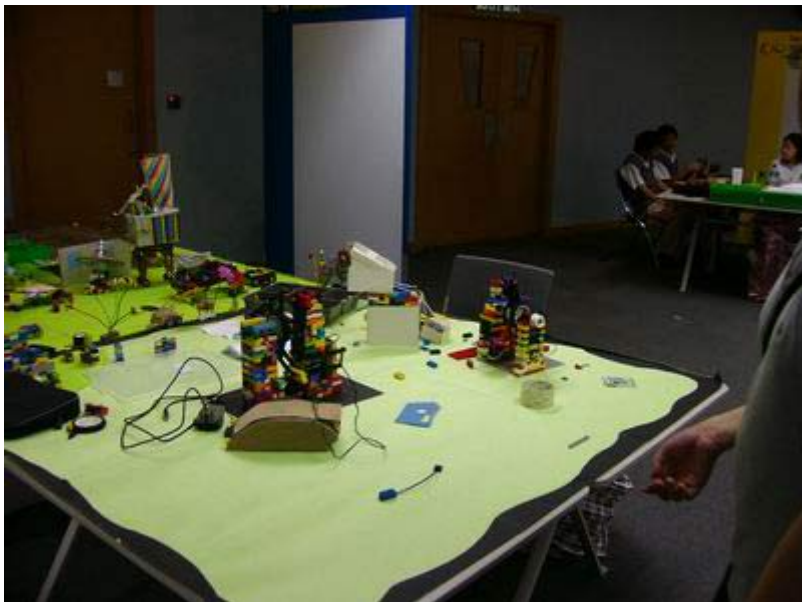
图为：学生设计的作品展示

第四个指导原则是营造一个彼此尊重、彼此信任的环境。原因之一是我们希望孩子们长大后可以成为合格的社会成员，而信任和尊重他人是成为一名好公民的必要条件。但这并不是唯一的原因：我们发现如果我们想要在其它几个原则上取得成功，想要孩子们来到电脑俱乐部根据自己的经验进行设计，就必须提供给他们一个相互信任的环境。一个孩子在设计一个东西的时候，不会一开始就成功。如果他在遭到失败的同时又受到其它孩子的嘲笑、捉弄和奚落，那么他可能就不愿再去尝试了。想成为一个好的设计师，就必须敢于冒险，乐于冒险，但人们是不愿意在一个缺乏信任和尊重的环境中冒险的。所以我们认为创造一个彼此信任和尊重的环境非常重要，这样孩子们就愿意冒险，愿意尝试新的想法，并能从中学到知识。