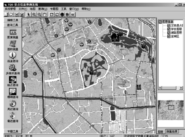
图3 景点查询系统操作界面 Fig.3 Interface of Scenic Spot Query System