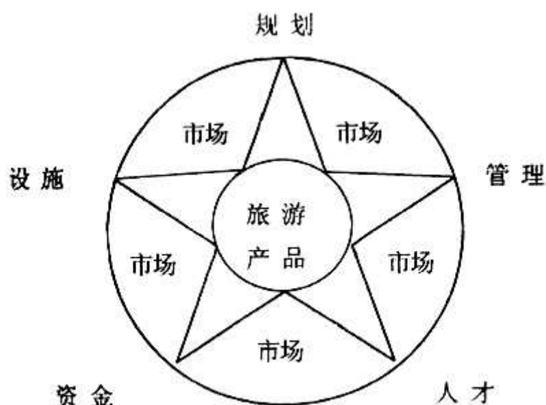
图2 乡村旅游产品生产过程问题分析图 中国城市发展网

从图2中可以看出这一环节的问题主要是围绕旅游产品生产而展开的，规划、资金、人才、设施、经营管理等问题既相互关联、相互支撑，又相互制约。为此，要顺利解决生产过程问题，必须全盘运作，提高整体生产能力。