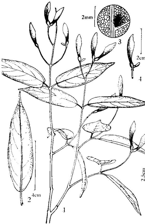
图3 美脉槭 Acer caloneurum C. Y. Wu et T. Z. Hsu 1. 果枝; 2. 叶背; 3. 叶背放大, 示簇毛; 4. 翅果。

常绿乔木,高 25—30 米,胸径达 75 厘米。树皮黑褐色,粗糙。小枝圆柱形,无毛,黑灰色,疏具长圆外皮孔。冬芽卵球形。叶厚纸质,长椭圆形,长 8—15 厘米,宽 4—6 厘米,全缘,先端短急尖,具长 1.5—2 厘米的尖尾,基部楔形,上面绿色,有光泽,背面被灰白色白粉;主脉在上面明显,在背面凸起,侧脉 9—12,连同网脉在两面明显;叶柄粗壮,长 2—3.5 厘米,无毛,顶端膨大,具关节。花未详。果序总状,长 7—12 厘米,着生于有叶的枝旁,被柔毛;小坚果扁平,长 6—8 毫米,被白色绒毛,翅镰刀状,红色,宽 8—10 毫米,连同小坚果长 2—2.3 厘米,张开成锐角或钝角。果期 10 月。