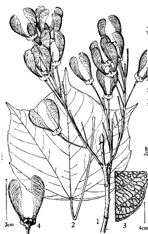
图1 川南槭 Acer longipedicellatum C. Y. Wu 1. 果枝; 2. 叶; 3. 叶背部分放大; 4. 果。

乔木,高8米,小枝褐色,密被皮孔。叶厚纸质,长圆状披针形,长(8—)10—14厘米,宽3—4.3厘米,先端渐尖,具短尖尾,基部楔形,全缘,两面同色,无毛;主脉在上面明显,在背面隆起,侧脉6—8对,在上面可见,在背面微隆起,网脉极细窝状,在两面明显;叶柄长(1.5—)3—5厘米,褐色,无毛,先端膨大。花未详。聚伞果序;小坚果特别凸起,具稜,长