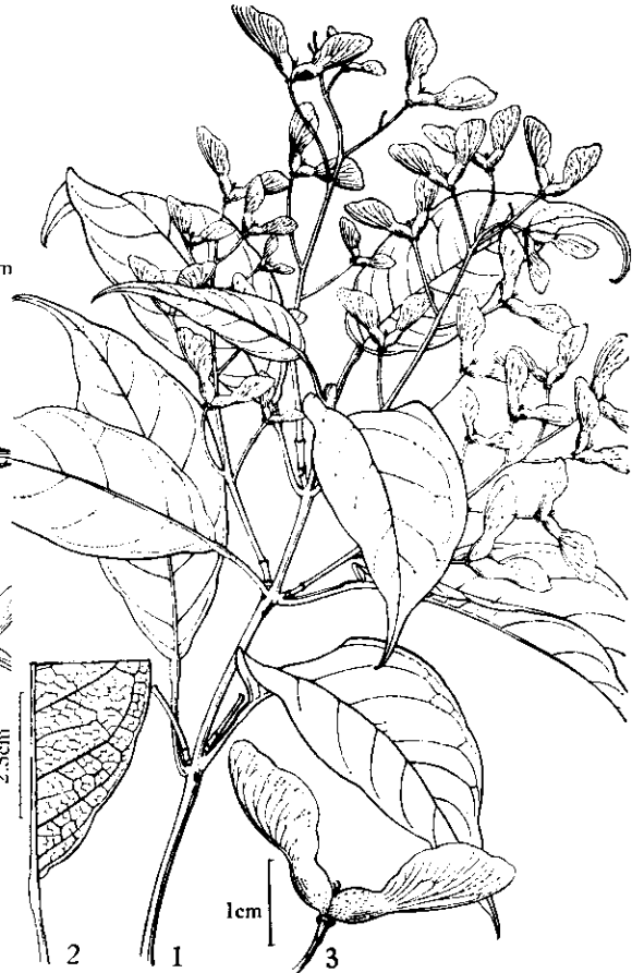
图4 景东槭 A. jingdongense T. Z. Hsu 1. 果枝; 2. 叶背部分; 3. 翅果。