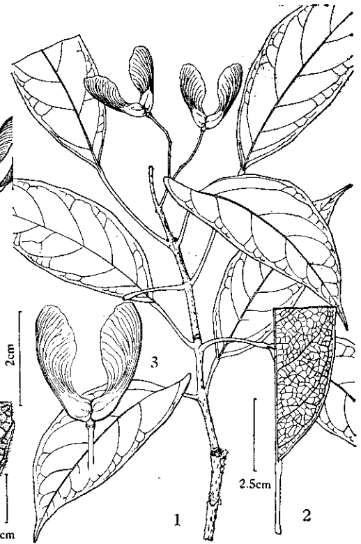
图2 路边槭 A. foveolatum C. Y. Wu 1. 果枝; 2. 叶部分放大示窝状网脉; 3. 果。