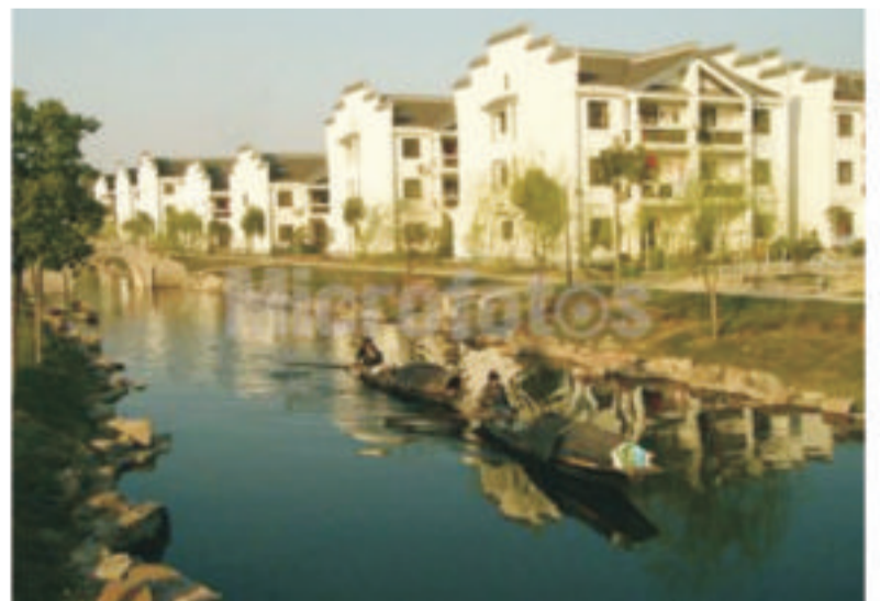
图2 中国南方新农村景观

3.2 有机更新农村建筑及地域人文特色 原有的农村旅游经济收入形式仅在农家乐基础上突出住、行、娱乐的特色,和其他大多数地域的农村食文化基本一致,从留住本土资源的角度出发,在现有的植被、水体、稻田及各类农作物的基础上形成合理的村落形态、房屋建筑形式结构、生态植物景观、山水聚落用以构成主要体验式短程旅途的主体,将人们引入到山村的林业生态景观、牧村的游牧或季节性聚落、渔村的以舟楫为家的水上景观中去,对拥有较多农村企业、家庭工副业的中心村进行有机的整体景观开发,将乡土文化元素层次丰富地配搭于建筑及道路周边景观中,使其给人以生态、色彩丰富之感(图2)。四川省凉山州木里县鸭嘴牧民新村规划则通过建筑单体色彩、民族符号的运用,较好地反映了地域建筑文化特色。