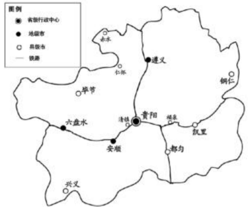
图1 贵州省城市分布