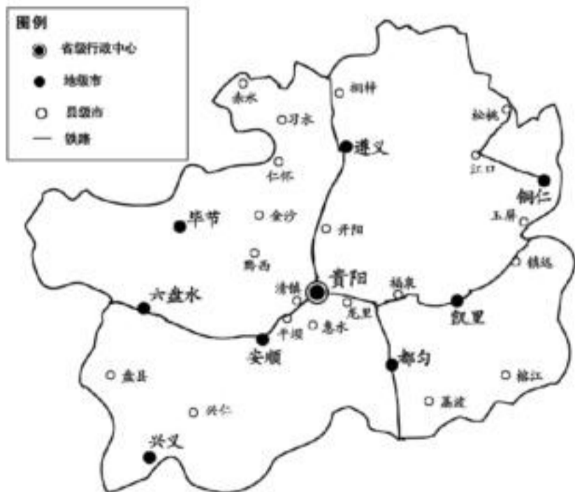
图2 贵州省城市发展设想

3.1 增加城市数量,扩大城市规模,合理布局和重点建设区域中心城市 据统计,全国范围内多数省区地级市的数目等于其行政区划数,而贵州有9个行政区划地区却只有4个地级市,另5个地区的行政中心所在地的城市仅为县级市,4个地级市中除贵阳市外,均为中等城市,很难发挥区域中心城市对地区的带动和辐射作用。因此,今后加快贵州城市与区域一体化发展的基本趋势应是积极发展地域性的大城市和中小城市,迅速扩张城市数量。其重点:一是以地级市为主发展大城市,争取把多数市、地、州所在地都培育成50万人以上的大城市;二是把一批有条件的县城发展成为小城市;三是发展大城市周围的中小型卫星城;四是发展风景旅游地区的中小城市。建议把六盘水、遵义和安顺3座地级市发展为50万人以上的大城市;提升部分城市的等级,把作为地区行政中心的铜仁、毕节、兴义、都匀、凯里5座城市提升为地级市,使贵州地级市数目等于行政区划数。提升部分县级市为地级市后,及时补充并增加县级市的数目,其数量应多于地级市的数量,从地理位置、交通因素及经济发展现状考虑,建议把金沙、黔西、盘县、习水等经济强县,镇远、荔波等旅游大县,城市空洞区内大县榕江、兴仁县、纳雍县提升为县级市;把交通发达、距贵阳较近的惠水、平坝、龙里建设成贵阳的卫星城(图2)。县级市的增补及卫星城的建设既可以促进该地区经济发展,又便于形成城市发展的点-轴系统,从而加快贵州区域经济空间一体化发展。