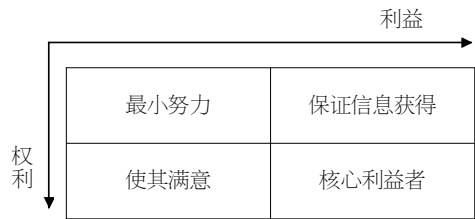
图2 利益相关者图谱: 权力-利益矩阵 (Markwick, 2000)

4.2 编制区域合作规划 编制苏北区域旅游合作规划是苏北区域旅游合作的前提和保障。苏北合作规划应该在各地旅游规划的基础上,聘请专家全面调查和评价。可利用访谈或其他社会调查方法收集和了解相关者对旅游规划与管理政策、措施的态度和方法。苏北可以整合资源优势,发挥整体效益,联合开拓苏北楚汉文化游、明清小说游、运河风光游和山海生态游等区域联合旅游线路。在区域内部开展市场调研,共同进行旅游营销,区域各地互为客源地和目的地,共同开拓客源市场,如利用汉文化和西游记在海外的巨大影响,共同开拓楚汉文化游和西游记文化游的海外市场。