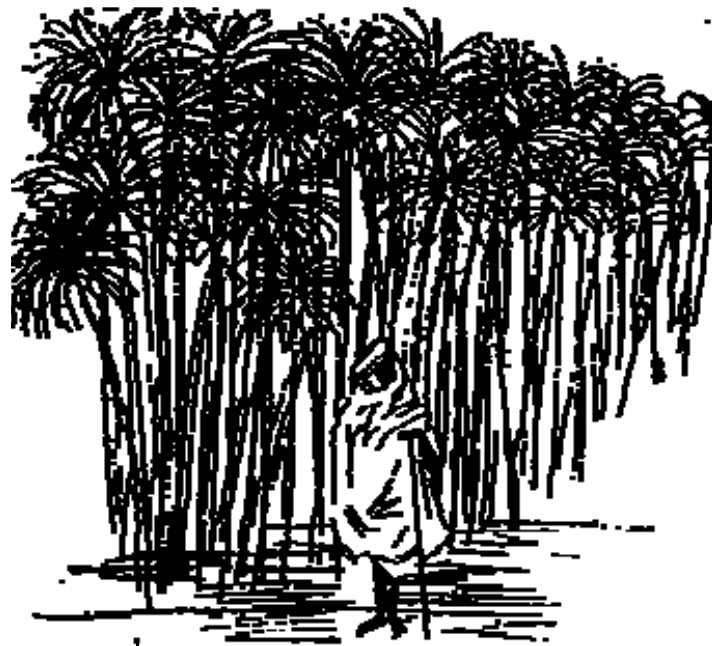
图 3-2 纸草多生长在沼泽地

纸草(Papyrus)是超过五千年前在地中海国家中最主要的书写媒介，古埃及人最为常用。