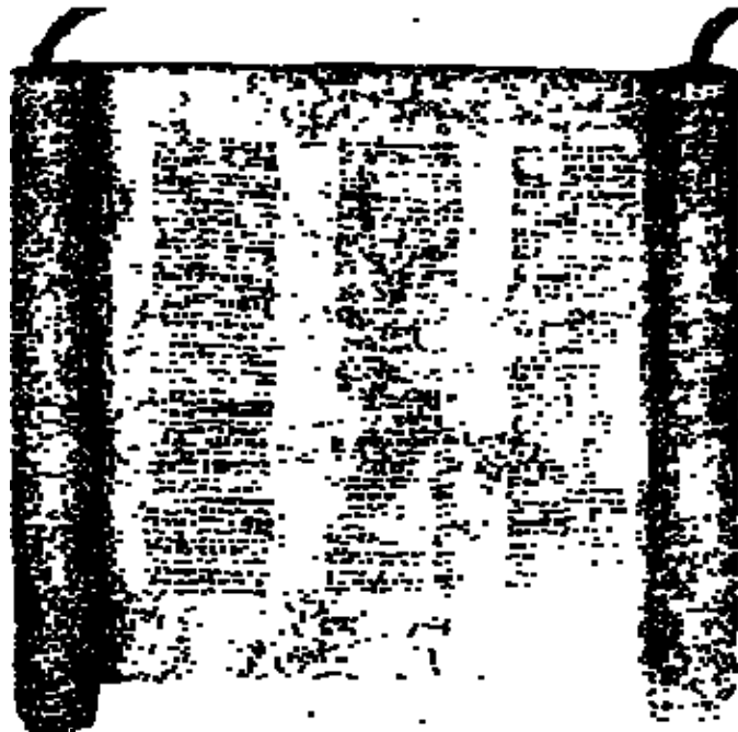
图 3-5 纸草做成的卷轴书籍

由于纸草不适宜摺叠，不能做成书本，因此须将许多纸草片黏成长条，并于写字后卷成一卷，就成了「卷轴」(图 3-5)，拉丁文是“Volumen”。