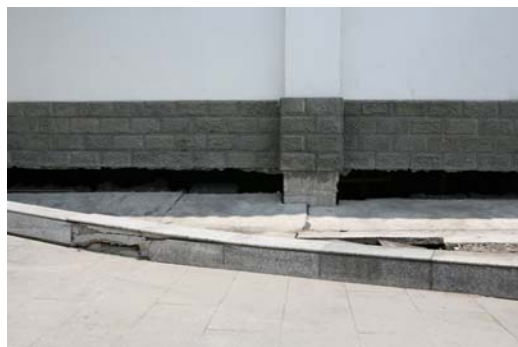
图 9 紫坪铺水利工程副厂房大楼的地基沉降