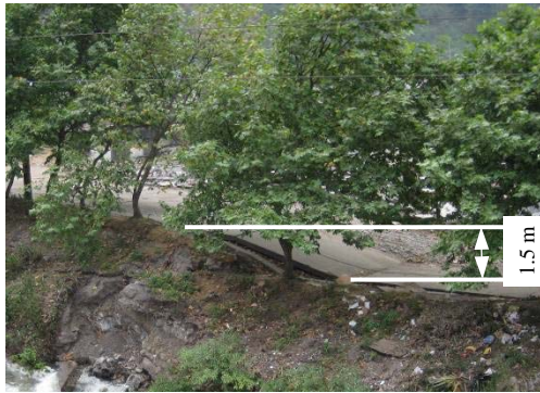
图3 灌县—安县断裂在汉旺镇绵远河右岸公路产生的地表破裂带