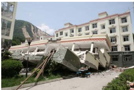
(a) 映秀镇漩口中学坍塌的 5 层教学楼