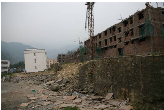
图 16 漩口镇的浆砌石挡墙破坏现象

防护网, 不论是主动的还是被动的, 抗震性能均较差。G213 国道紫坪铺库区段的主动防护网损坏严重, 被动防护网往往因崩塌方量太大, 不堪重负而破坏。浆砌石挡墙的抗震性能较差(见图 16), 混凝土重力挡墙较好。锚索支护、锚索格构支护、锚喷支护和抗滑桩的整体表现良好。图 7 所示的北川县城滑坡右侧未滑出部分就是抗滑桩加固的成果。图 17 比较了紫坪铺水利枢纽边坡支护与不支护的效果差异。