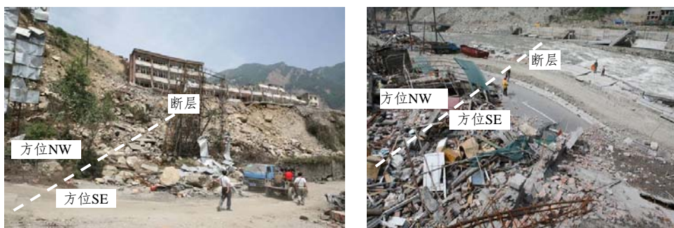
(a) 渔子溪大桥附近, 镜向 NE