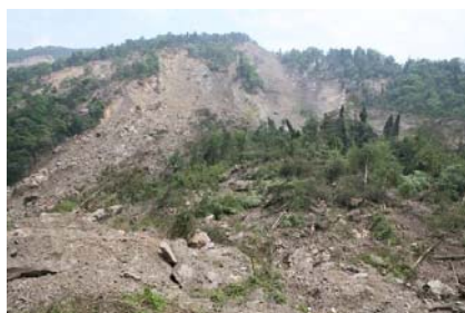
图 14 石亭江红松一级电站滑坡