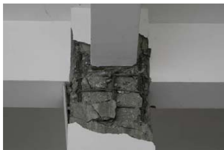
(b) 结构柱常见的破坏形式