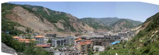
图 7 东北段建筑结构的破坏形式