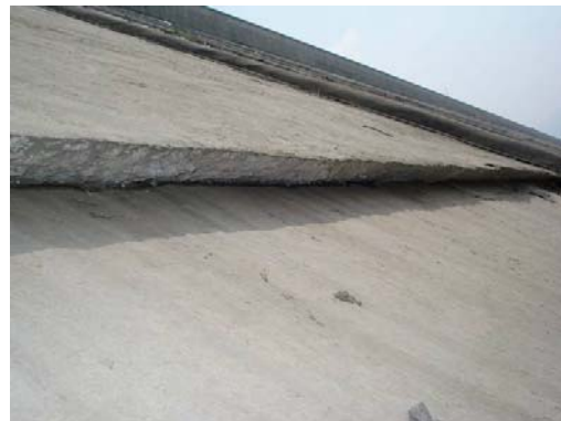
图 18 紫坪铺大坝面板位错现象

大型水电工程为抗震救灾作出了重大贡献。唐家山堰塞湖处理过程中, 其下游水库全面放空, 对可能的溃坝洪水起到了拦截和削峰作用。紫坪铺水利枢纽的大坝为面板堆石坝, 坝高 156 m, 按地震烈度 VIII 度设防, 加速度为 0.26g 。本次地震中坝址区出现了控制系统震损导致发电机组停转、冲沙闸和泄洪洞闸门无法开启、大坝沉降(73~100 cm)导致上游二期和三期混凝土面板之间结构缝位错和局部面板开裂(见图 18, 19), 泄洪洞在 F_3 断层通过