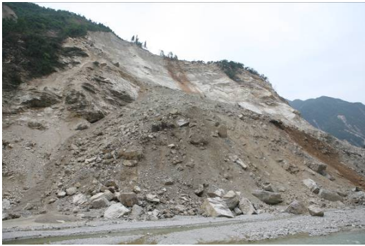
图 10 绵远河汉旺镇上游右岸的逆层滑坡