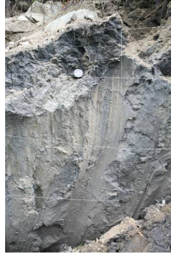
图5 北川—映秀断裂在虹口乡产生的基岩地表破裂带

的水平与垂直错动带也出现在虹口乡，分别达 4.8 m (深溪沟村)(图 4(b))和 5.1 m(八角庙村)(图 4(c))。目前发现的唯一基岩错动带也出现在八角庙村的三叠系中统须家河组煤系地层中，其多期错动和右旋错动特征明显(见图 5)。