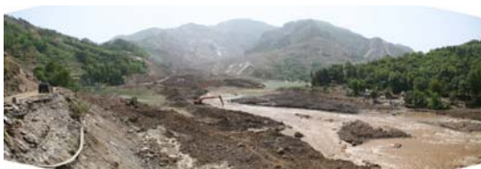
图 11 青川县关庄镇东河口高速滑坡全景

庄镇的东河口滑坡(见图 11)为典型的切层滑坡。东河口滑坡的方量初步估计在 800 \times 10^4 \text{ m}^3 以上, 滑坡高速下滑, 冲入前沿的红石河, 并在对岸爬高 70 m, 然后顺青竹江继续滑行近 1 500 m, 分别在青竹江和红石河各形成一个滑坡坝。滑坡摧毁东河口村 4 个社和邻近的关庄镇沙坝社区的 1 个社, 以及东河口电站, 约 260 户 700 人被全部掩埋。一辆从青川县城开至石坝乡方向的客运中巴车也被掩埋, 车上载有 20 余名乘客。岸坡松散堆积物滑动也很常见, 青川县红光乡红石河滑坡较为典型, 该滑坡方量小于东河口滑坡, 但是速度很高, 产生的气浪令对岸高程约 70 m 的小麦(图 12 中人站立之处)全部倒伏。