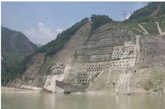
图 17 紫坪铺水利枢纽冲沙洞出口边坡支护效果比较