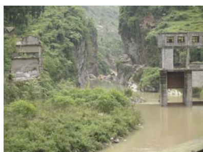
图 15 石亭江燕子岩滑坡坝