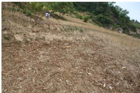
图 12 青川县红石河高速滑坡气浪产生的小麦倒伏现象