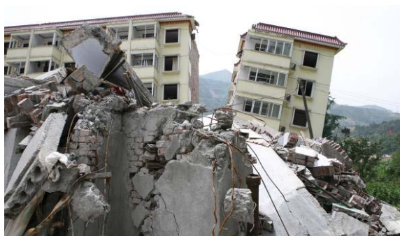
图 8 映秀镇阿坝州烟草公司宿舍楼倾斜