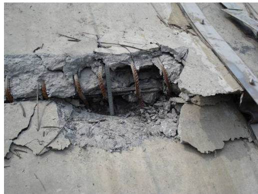
图 19 紫坪铺大坝面板开裂现象