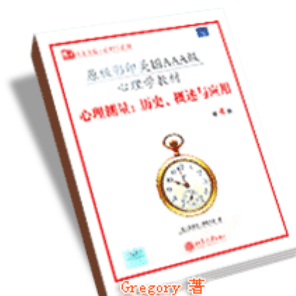
Gregory 著 《心理测量：历史、概述与应用》(第4版) 北京大学出版社 2005