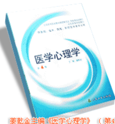
姜乾金主编《医学心理学》(第4版) 人民卫生出版社 2002