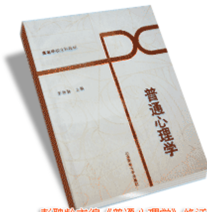
彭聃龄主编《普通心理学》修订版 北京师范大学出版社 2001