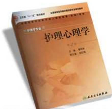
曹枫林、张纪梅著《护理心理学》(第2版) 人民卫生出版社