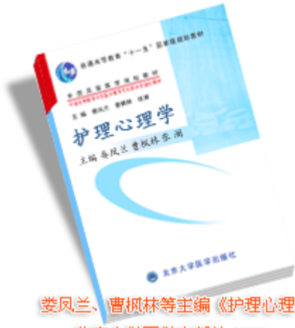
姜凤兰、曹枫林等主编《护理心理学》 北京大学医学出版社 2006