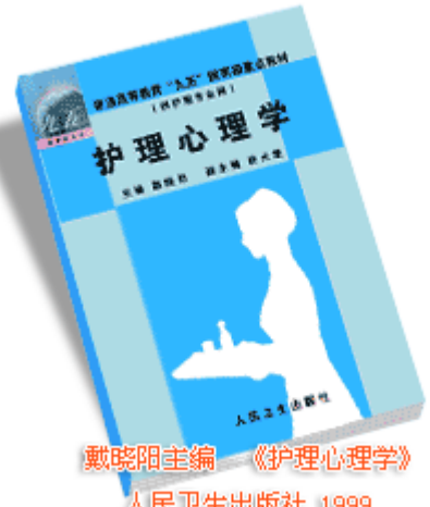
戴晓阳主编《护理心理学》 人民卫生出版社 1999