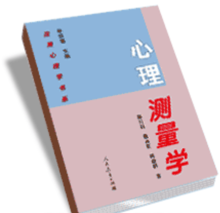
郑日昌等 著 《心理测量学》 人民卫生出版社 1999