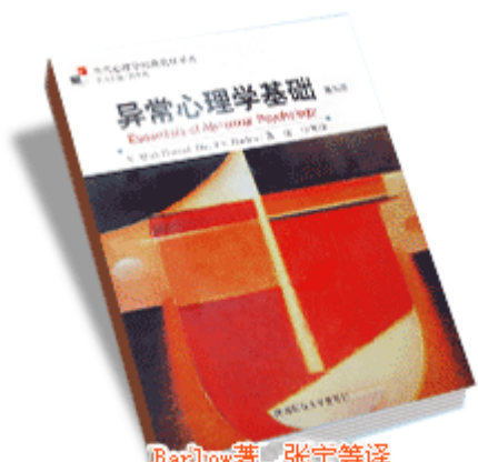
Barlow著,张宁等译 《异常心理学基础》(第三版) 陕西师范大学出版社 2005