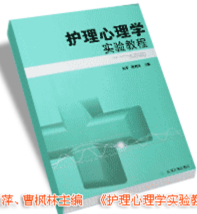
厉萍、曹枫林主编《护理心理学实验教程》 山东大学出版社 2007